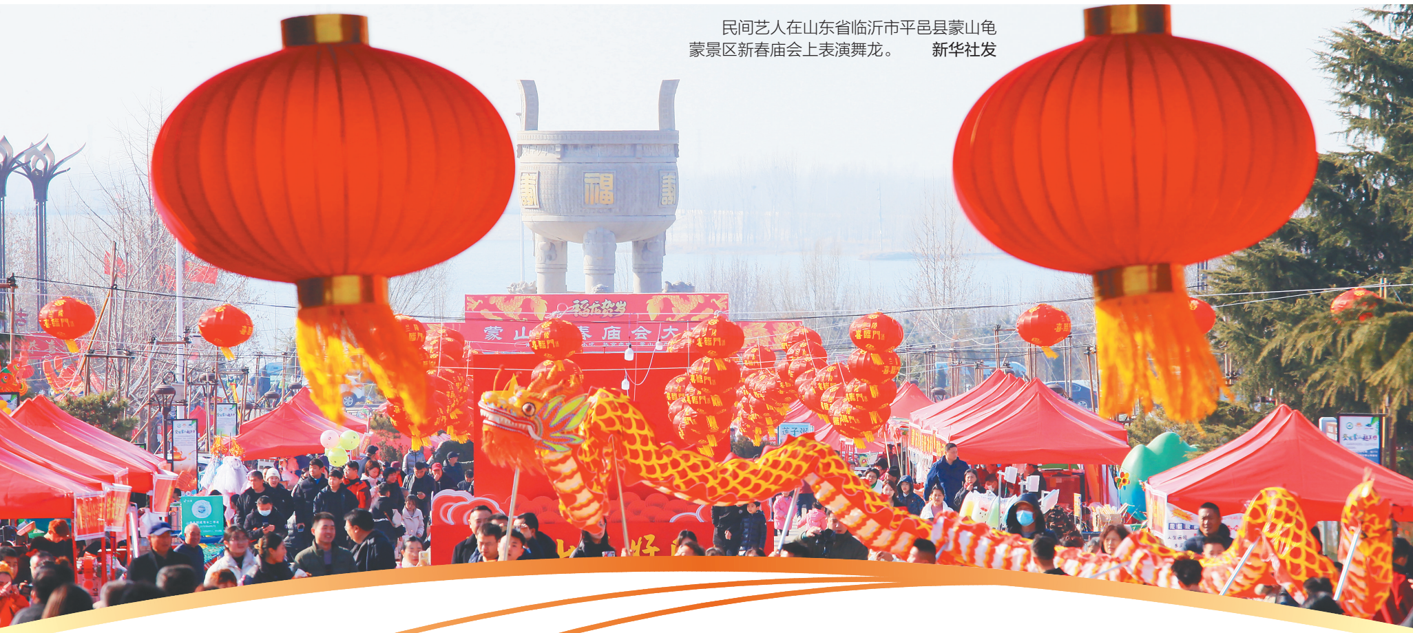
民间艺人在山东省临沂市平邑县蒙山龟蒙景区新春庙会上表演舞龙。

在传统庙会上体验民俗,为新年祈福;到新春灯会上赏灯,品味流光溢彩;在热闹的大集和展会上挑选礼物,寄托对亲朋的牵挂。“逛”是中国人过春节常见的姿势,它折射出人们忙碌一年后欢度佳节的舒心。人们“逛”出家人团聚的团圆与幸福,更“逛”出社会蓬勃的活力。逛会赶集,在流动中感受浓浓的家国情怀和春节情怀。