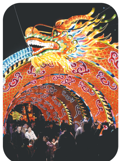
游客在河南洛阳王城公园龙年灯会上参观游园。