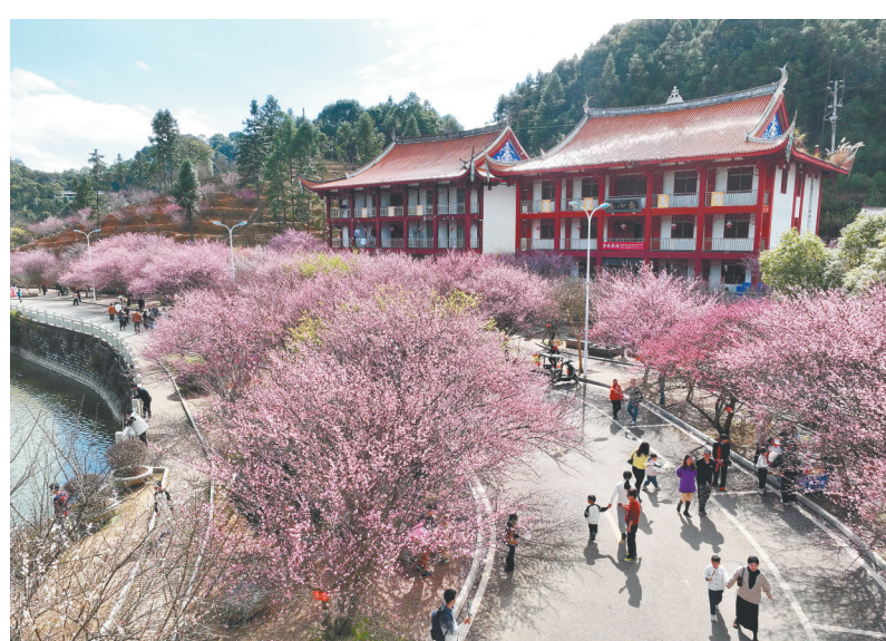
游客在福州林阳寺赏梅拍照。

以花为纽带,福建不少地方探索“赏花+休闲采摘”“赏花+煮茶”等模式,通过打造观赏游玩、采摘加工、文化休闲业态,打通一二三产业,走出一条以“花”为媒打造“美丽经济”的新路径。(据新华社福州2月12日电 记者庞梦霞)