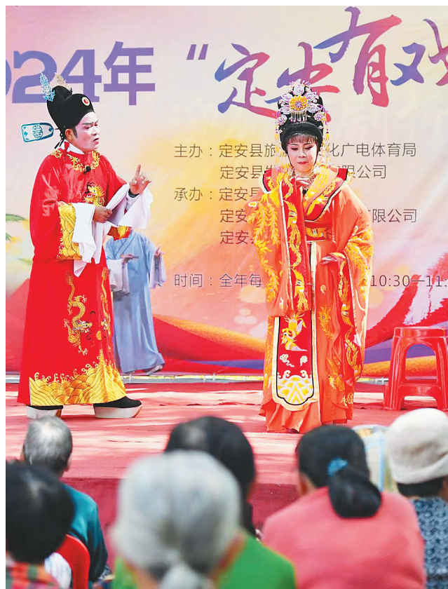
2月14日,定安有“戏”琼剧体验活动在定安县定城镇老县衙遗址举办,吸引广大戏迷前来观看。