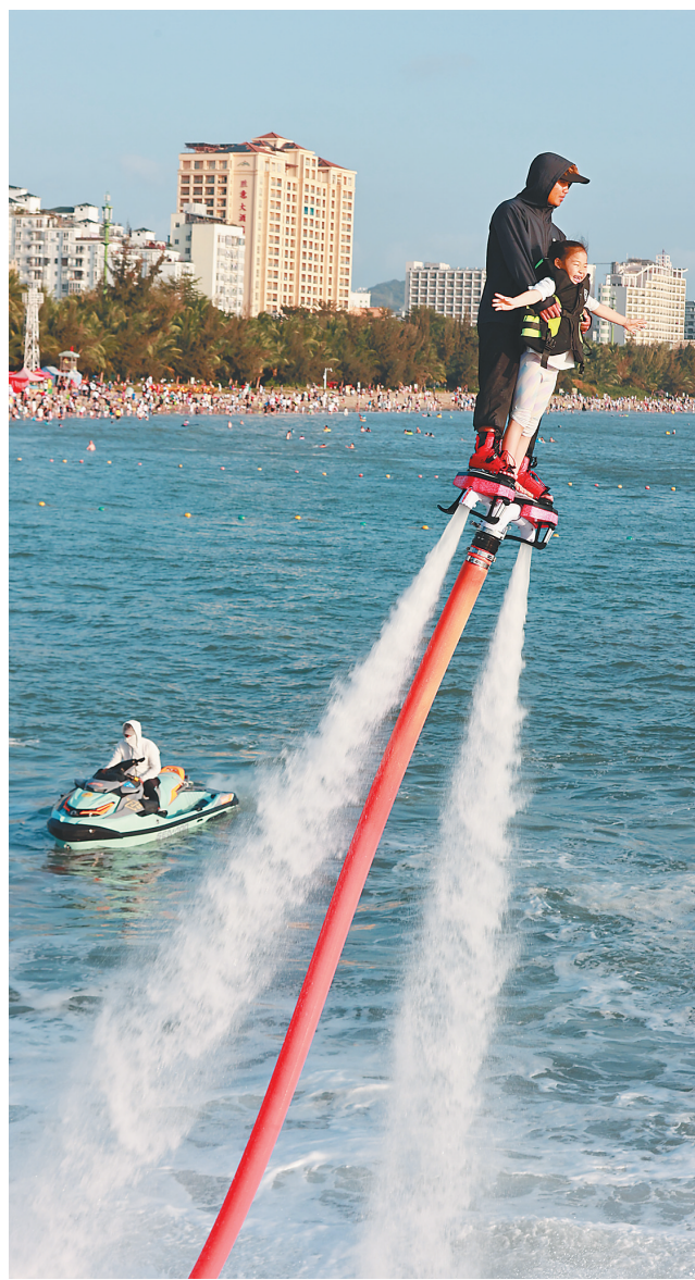
2月13日,三亚湾海月广场附近海域,游客体验海上运动项目。

“我们还推出七大项目免费特色服务,为来万宁王府井国际免税港的消费者提供多元化购物体验。”王府井国际免税港市场部经理姜畔介绍,2024年春节王府井国际免税港游客和销售再创新高。大年初一当天,全场销售突破1500万元,同比增长27.3%;全场客流近65万人次,同比增长30.7%。同时,近400个免税品牌销售业绩创历史新高。 (本报万城2月14日电)