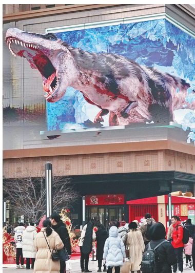
市民在北京王府井商业街观看裸眼3D大屏幕的动画。

山东各大滑雪场推出更具参与性和观赏性的雪地足球、冰上拔河、雪地魔毯等冰雪项目；上海10余块固定冰场、10余块季节性移动冰场吸引冰雪运动爱好者“打卡”；冰雪游持续吸引市民来到北京郊区，带动雪场周边餐饮、住宿、休闲娱乐等生活消费。(据新华社北京2月14日电)