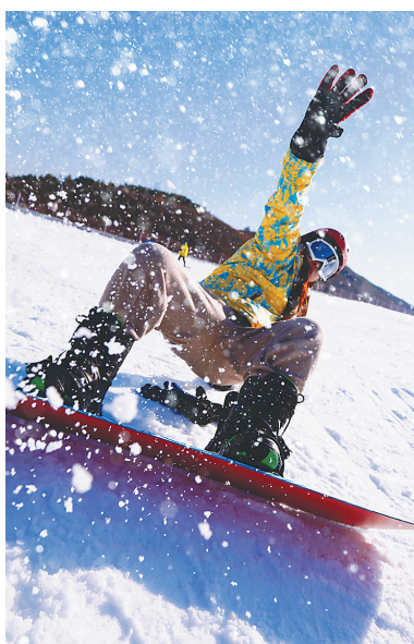
游客在山东济南莱芜雪野滑雪场滑雪。