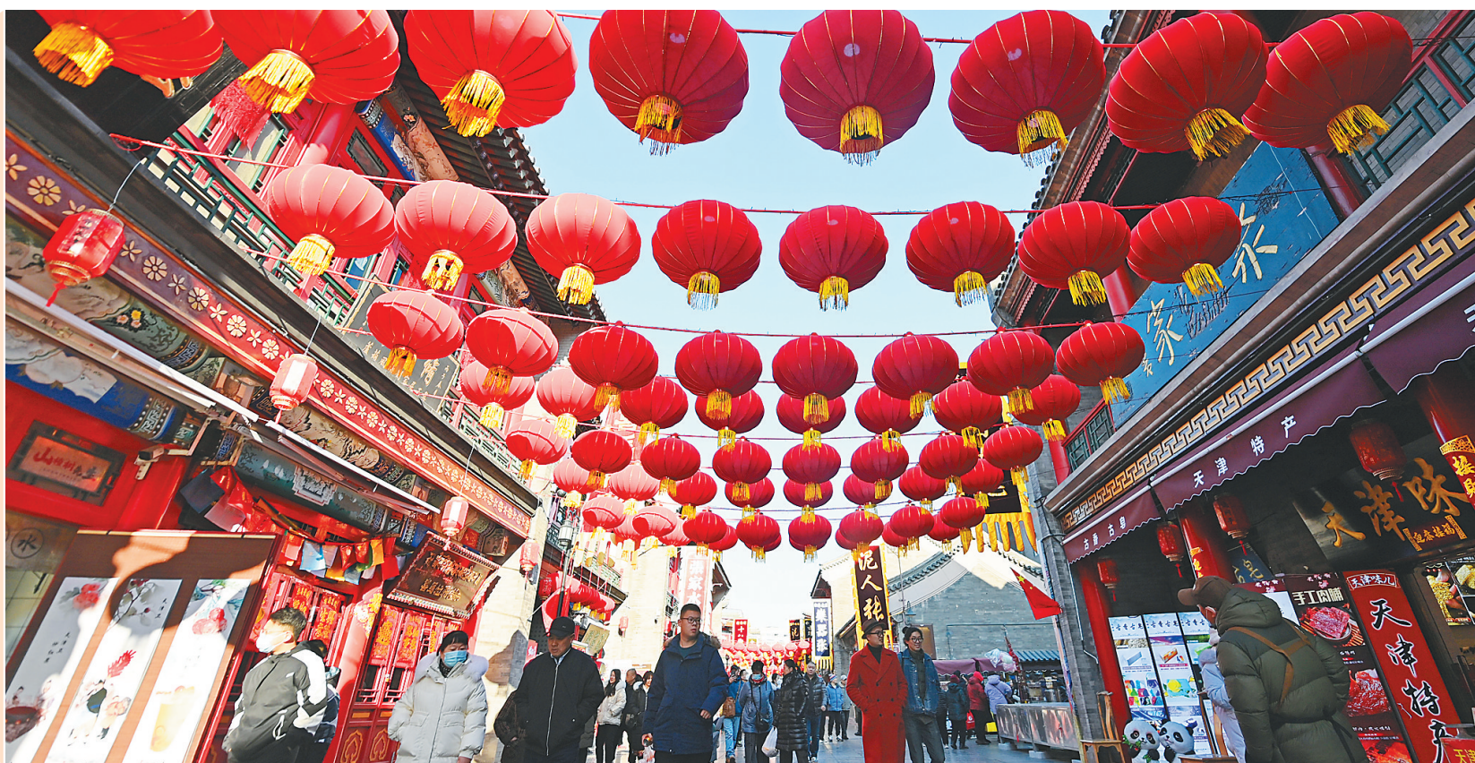
游客在天津古文化街游览。

龙年春节，从线下到线上，从城市到乡村，火热的消费场面透着浓浓年味，让人感知到中国经济新春“市面”的脉动。