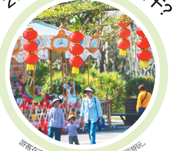
游客在海口市桂林洋国家热带农业公园游玩。