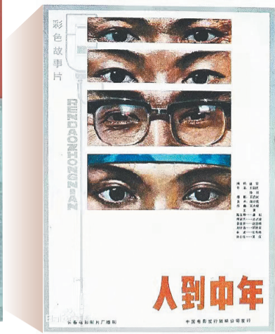
电影《人到中年》海报。