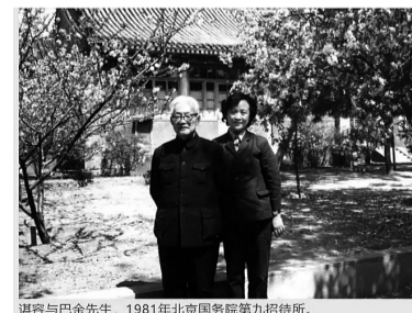
湛容与巴金先生,1981年北京国务院第九招待所。