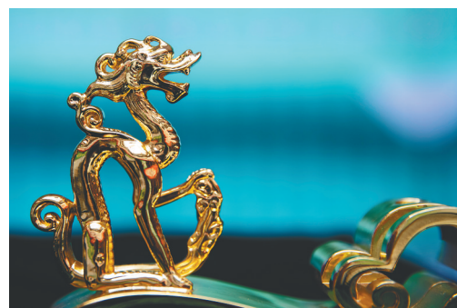
黑龙江省博物馆展示的云起龙骧案饰。

春节假期,中国(海南)南海博物馆里的游客不少,不少人都是奔着新鲜出炉的龙年文创而来。琼海市民李秀英一口气买了五套对联,“对联贴合生肖文化,和馆藏特色紧密贴合,制作精良,也很实用,自己家贴或送亲朋好友都合适。”