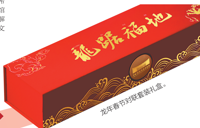
龙年春节对联套装礼盒。