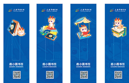
鹿小图亚克力书签。

设计团队在魔法书上画上了海浪和三亚市图书馆的logo,其中logo被设计成了镶嵌在书籍上的魔法宝石。当书本展开,借助知识的魔法力量,可以看到海南各地的风土人情。这样别具新意的设计让“鹿小图”的形象更加丰富和饱满,