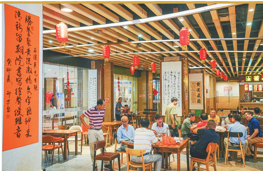
2月24日,在乐东黄流金街小吃城,人们在由书法作品装饰的早茶店里用餐。

写春联,贴春联,是中国人传统习俗。现在过年,家家户户还贴春联,但已经很少有人写春联了。乐东黎族自治县黄流镇是个例外,每年春节,这里依然书墨飘香,因为镇上有书法协会。