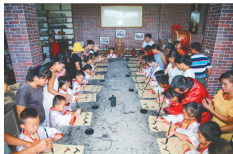
小朋友们在溪边书屋练习书法。