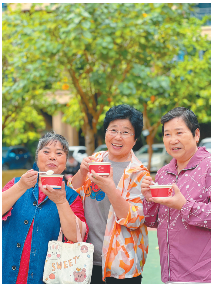
文昌椰城小区业主品尝美味汤圆。

据统计,整个春节期间,碧桂园在海南的各个小区共开展了超30场迎春社区活动,参与业主约2万人次。碧桂园物业以丰富多彩的社区文化活动为抓手,以基层党支部建设为引领,同步聚焦社区老龄关怀,努力提升业主居住的体验感和幸福感。