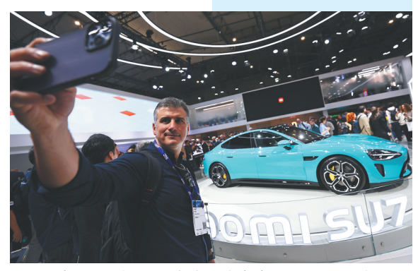
在2024年世界移动通信大会上,一名男子与小米SU7汽车自拍。

为期4天的2024年世界移动通信大会26日在西班牙巴塞罗那开幕。中国移动、中国电信、华为、荣耀、中兴、小米、科大讯飞等约300家参展企业在大会期间分享最新创新成果,并为通信行业生态系统建设带来更多中国智慧和解决方案,备受各方关注。