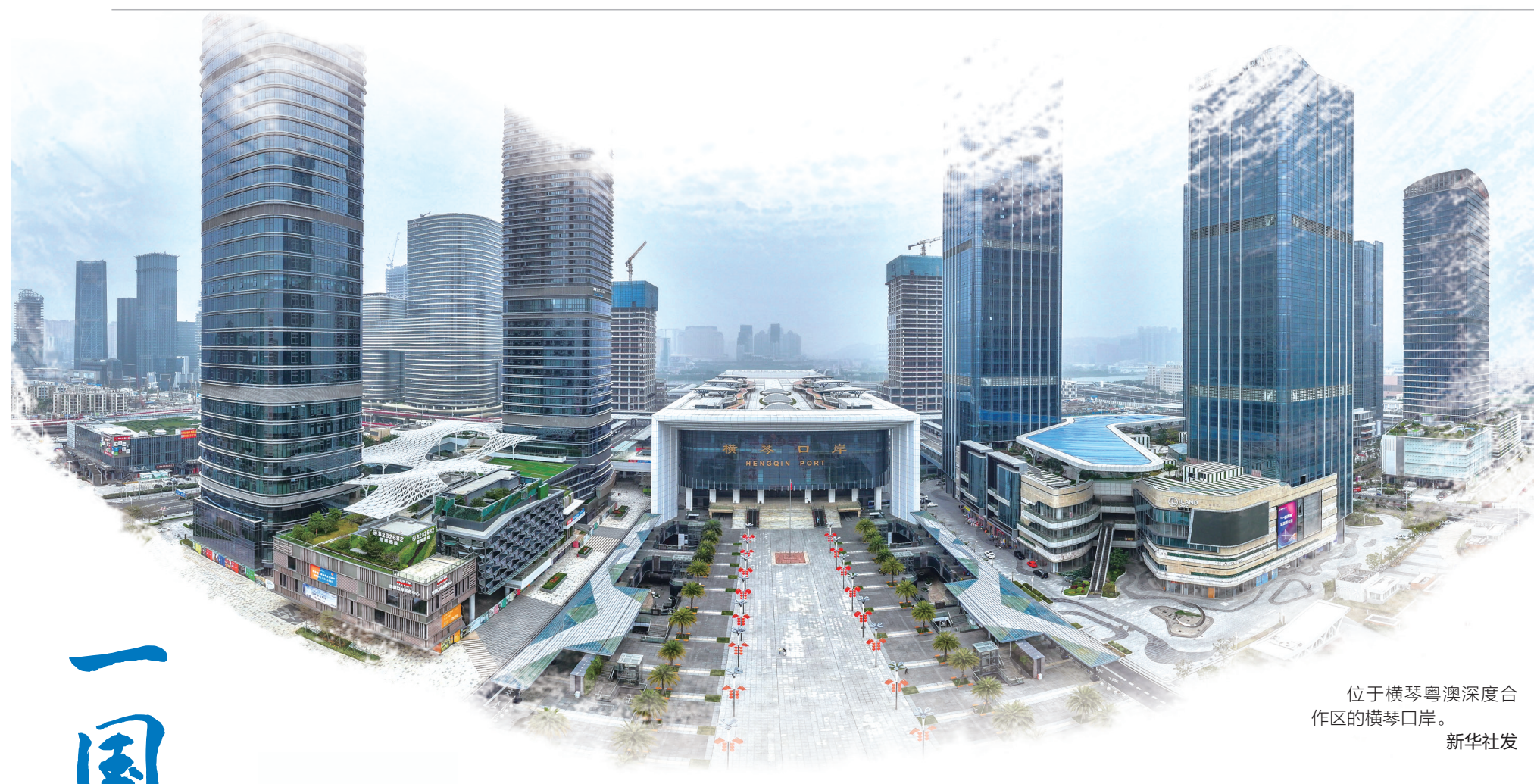
位于横琴粤澳深度合作区的横琴口岸。