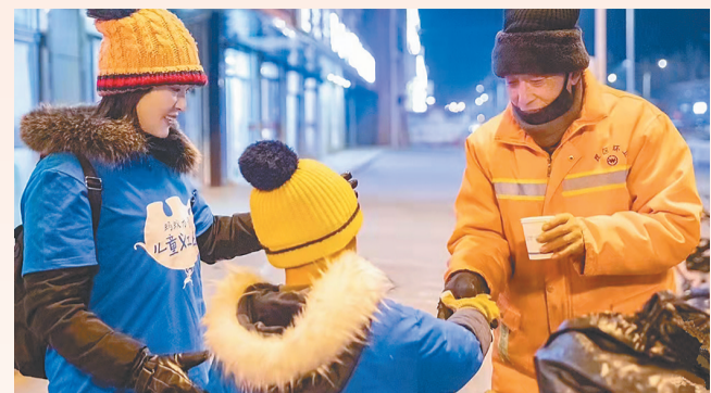
海南蚂蚁力量儿童义工为深夜工作的人送上热茶。