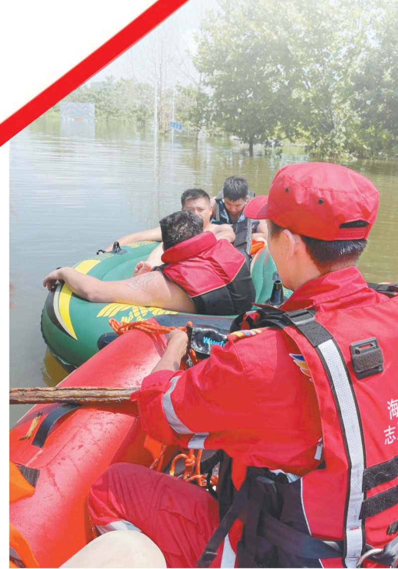
→2021年7月，海口民间灾害应急救援队在河南救援。

目前，海南大学青年志愿者协会敬老团队已和3家养老机构制定了长期送志愿服务计划，助力社会养老服务的发展。