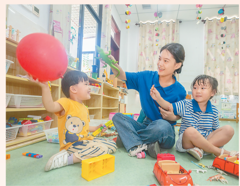
志愿者在暑假为孩子提供照护服务。