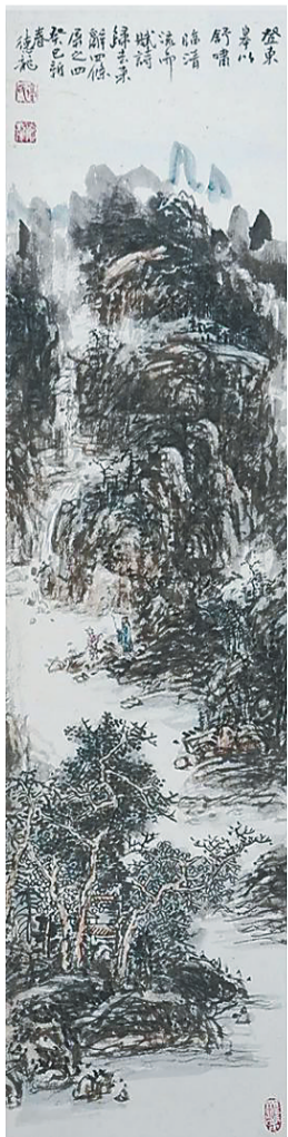
乔德龙国画作品《归来辞》四条屏。(局部)