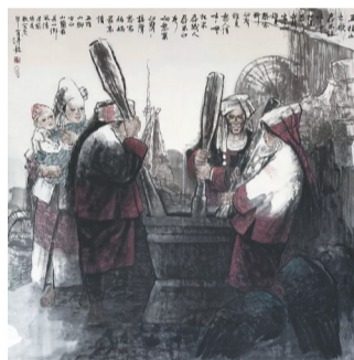
乔德龙国画作品《春米谣》。

另一方面，在表现形式上，他既不是一味克隆文人画“笔精墨妙”的程式，或当下流行的“刻意求工”的制作套路，而是本着“固本博取”传统笔墨的精华，融写实与写意、传统与现代为一体，以个性化的笔墨语言去实现个人观念的自由表达。