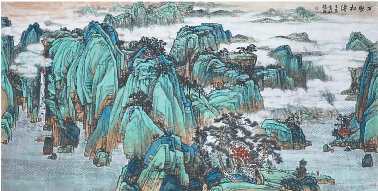
乔德龙国画作品《万壑松涛》。

2024年2月24日，画家、书画鉴赏家、“南海文艺奖终身成就奖”获得者、海南省博物馆原馆长，海南美术界德高望重的老前辈乔德龙先生在海口病逝，享年83岁。