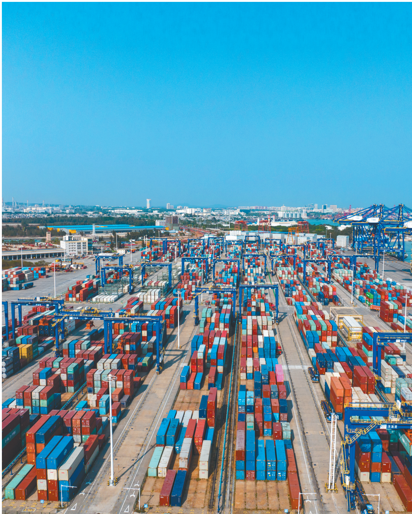
航拍繁忙的洋浦经济开发区小铲滩码头。