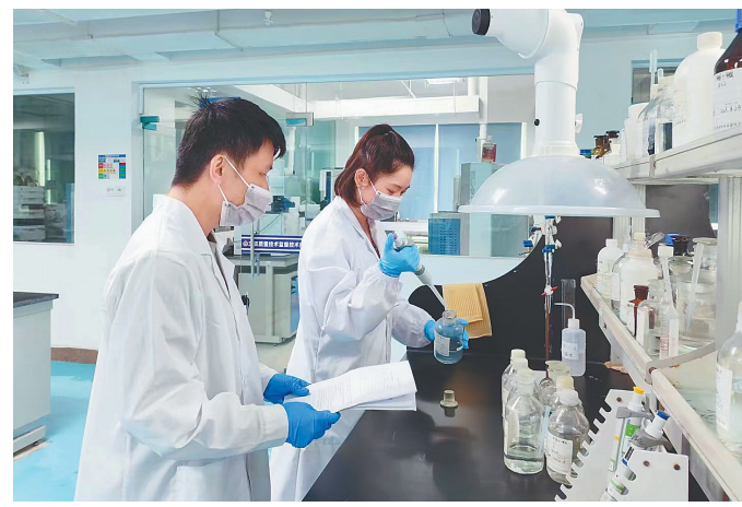
在三亚中国检科院生物安全中心，检测人员在做食品中碘值的测定。近年来，三亚崖州湾科技城已吸引一批企业和科研机构入驻。