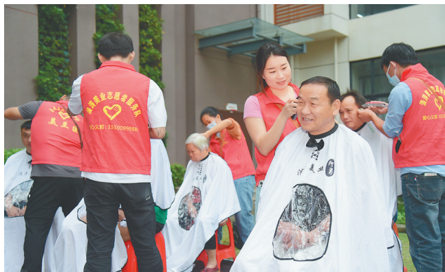
海口市美兰区在美兰区新时代文明实践中心开展重阳节主题活动爱心义剪活动。