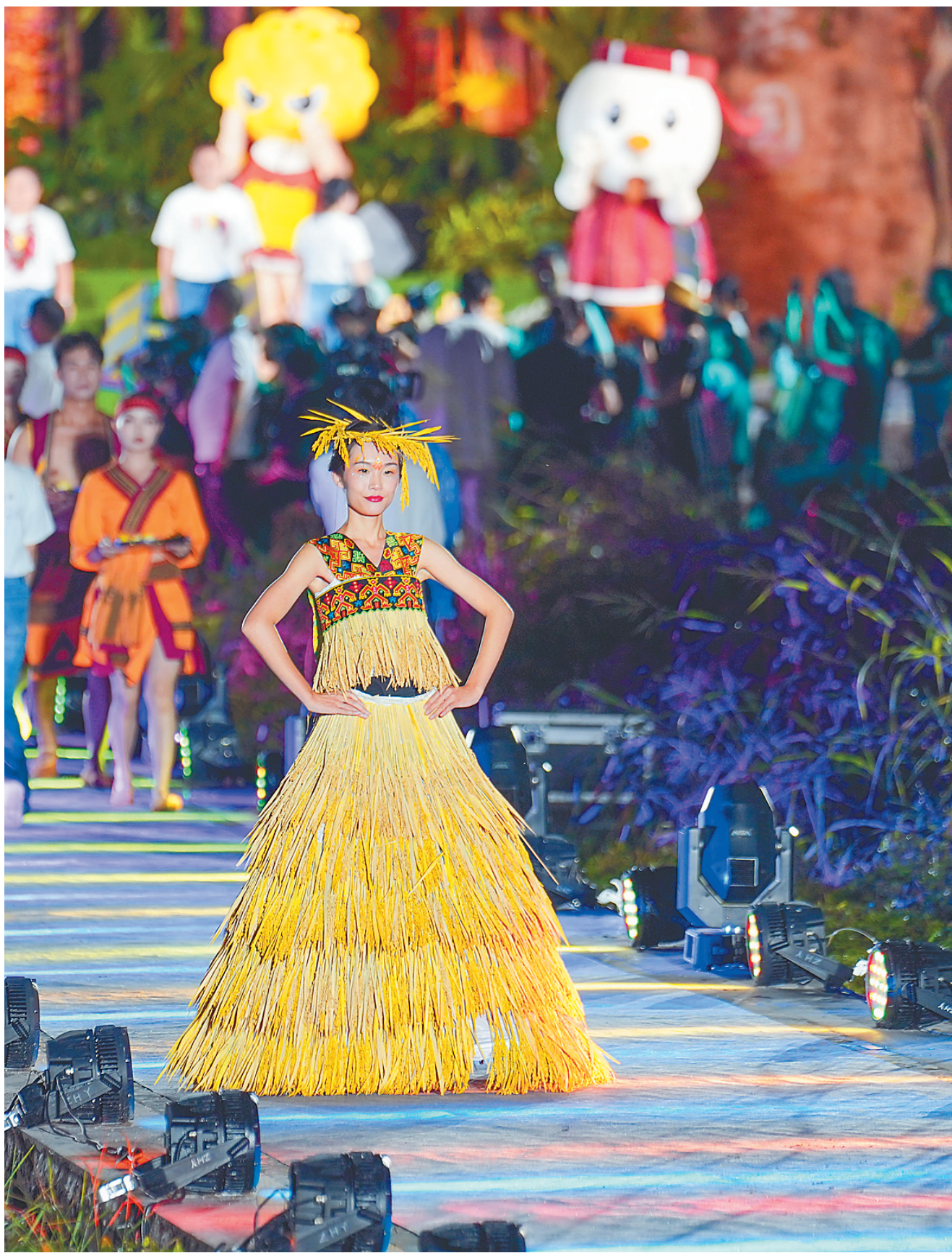
五指山市举办“民族秀 中国情”民族时装“村秀”活动。