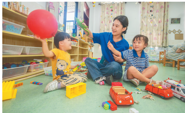
大学生志愿者走进三沙市永兴学校，开展声乐、舞蹈、趣味拓展等志愿服务。