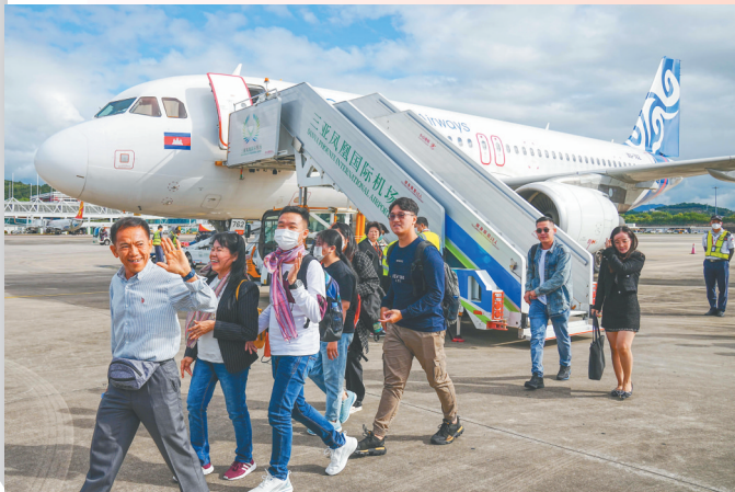
金边—三亚—新加坡航线的顺利通航，是海南省首次开通第五航权客货运航线。