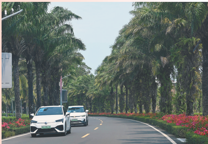
新能源车辆在博鳌东屿岛零碳示范区内。 资料图