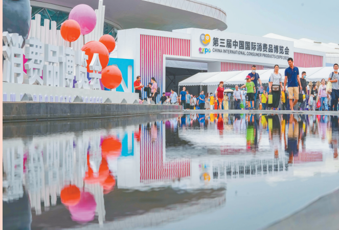
第三届中国国际消费品博览会现场。