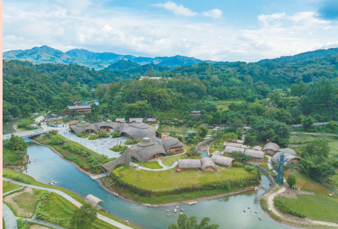
五指山市水满乡毛纳村将绿水青山变成“金饭碗”，村民走上了共同富裕之路。