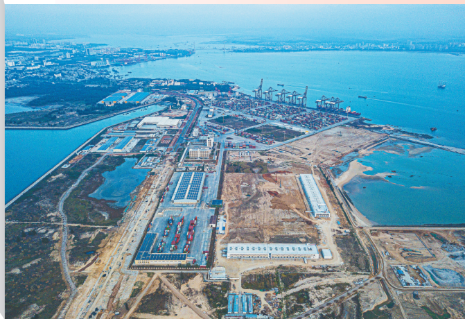
洋浦港封关运作项目和洋浦国际集装箱码头。