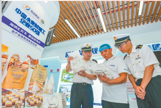
洋浦经济开发区海关、洋浦港海关工作人员深入企业，了解企业困难、帮助解决问题，让企业安心发展。