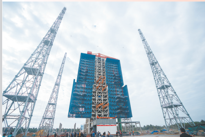
海南国际商业航天发射中心一号发射工位。