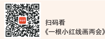
扫码看《一根小红线画两会》

本报海口3月6日讯（海报集团全媒体中心记者莫景云）3月6日，海南省融媒体中心推出两会特别策划《一根小红线画两会》。策划通过SVG互动的形式，以小红线为主轴，绘出一个个图形，有火箭、水稻、排球、汽车……将2024年政府工作报告中的关键词，与两会上老百姓关注的民生大礼包，通过小红线串联，“一笔到底”进行呈现。新颖的交互效果，搭配精练的文字内容，让政府工作报告更加直观易懂。