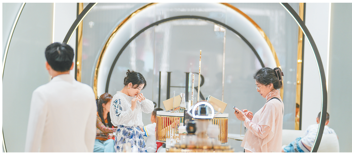
在cdf海口国际免税城，消费者选购香化类免税品。

聚焦农业发展，何琼妹则表示，海南是全国唯一同时适用自贸港政策和RCEP规则的省份，为农业“引进来”“走出去”创造了有利条件。海南可以借助这一自由便利的政策优势，抢抓RCEP带来的市场机遇，对标国际标准，培育一批农业国际贸易高质量发展基地，扩大优势特色农产品出口。（本报北京3月6日电）