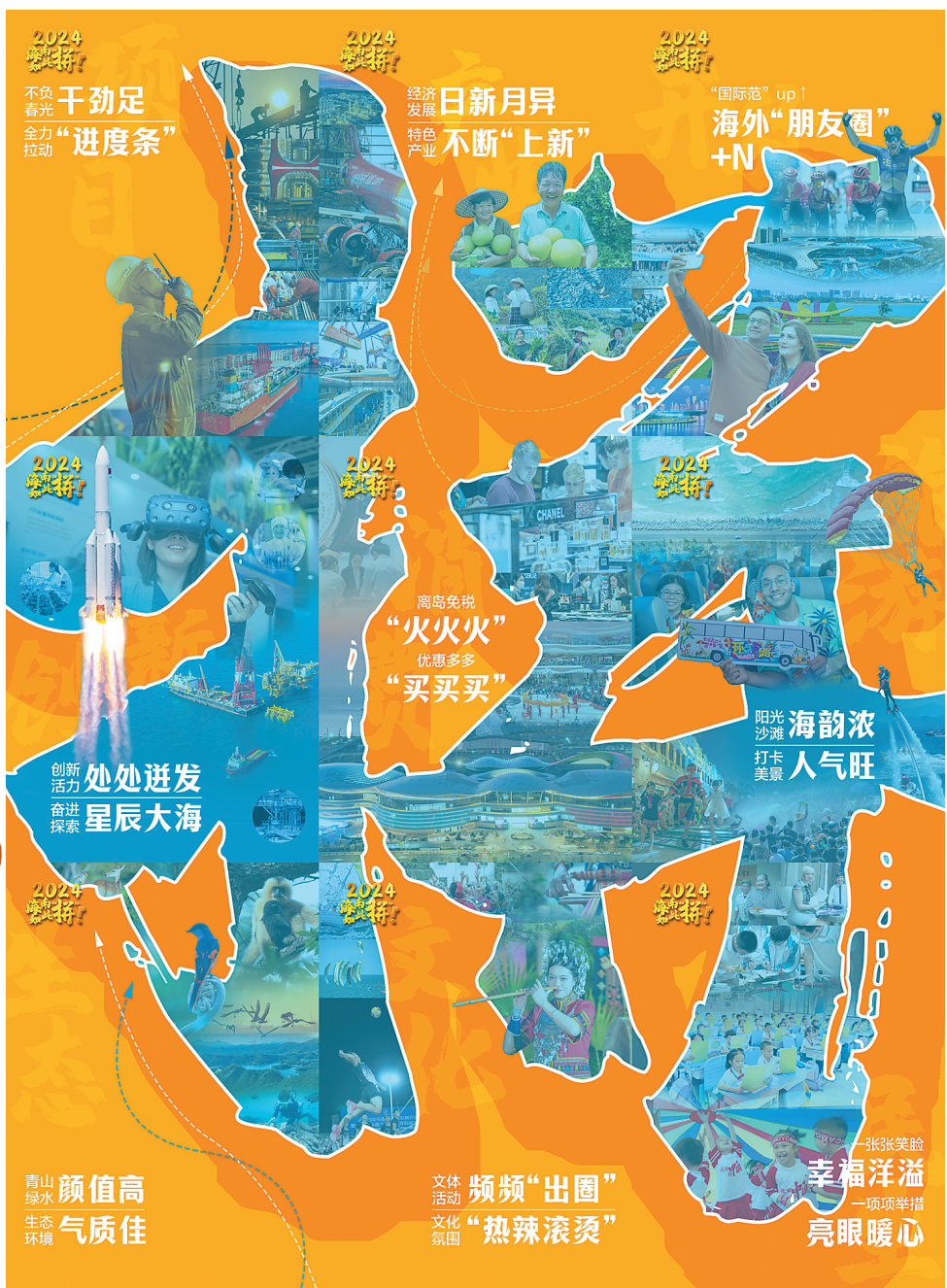
创意海报《海南如此“拼”!》。