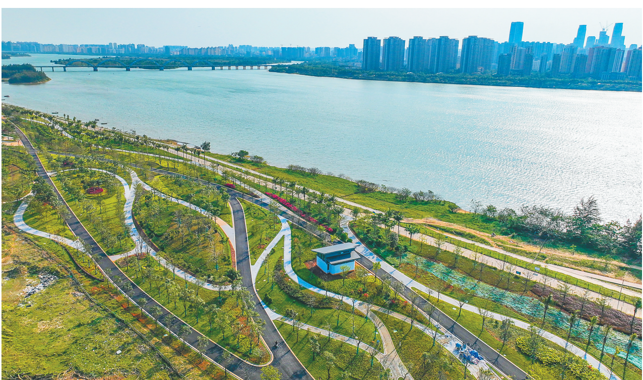
日前,俯瞰位于海口南渡江东岸的南渡江门户公园。据了解,该公园总占地面积约1.07平方公里,拟打造成集南渡江门户展示、景观游憩、健身运动于一体的综合性城市级休闲公园。

医结算工作采取多项举措:按照统一部署,扩大门诊慢性特殊疾病的跨省异地就医联网结算病种范围;继续优化异地就医备案,推进异地就医自助备案“即申即享”服务,提高及时办结率;将异地就医医疗费用“应结尽结”要求纳入协议管理,提高就医地住院费用跨省直接结算率;推进跨省异地就医结算费用“应清尽清”,提高结算资金清算时效;继续开展报错问题“即知即改”的常态化治理,不断提高跨省结算成功率。