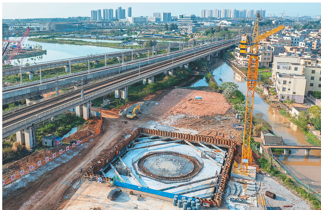
日前,俯瞰位于海口新海港片区“二线口岸”项目工地的海南目前最大转体桥主墩柱承台。

的人员、机械、材料,正全面推动施工提速提效,项目形象进度“日新月异”。 看到该主墩承台成形,海南交投项目建设管理有限公司海口片区负责人黄泽丰倍感振奋。 “这是整体项目的控制性关键工程,主墩承台成功浇筑,将为工程高效有序推进,保障建设进度打下坚实基础。”黄泽丰说,截至目前,项目累计完成施工桩基1703根,承台292座、墩柱267根,现浇箱梁15联,共完成固定资产投资超8.6亿元。 从这座承台向前方望去,项目现场呈现一派忙碌的施工景象。“建好承台,再造好墩柱,完成现浇箱梁,确保转体桥今年10月完成铁路转体对接,届时,全线桥梁主体结构将实现贯通。”孙维志说。