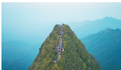
乐东尖峰岭登山道。