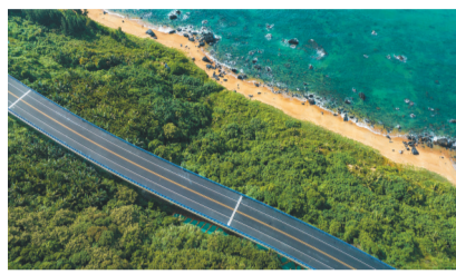
依山伴海的万宁正门岭大桥路段，两旁林木郁郁葱葱。