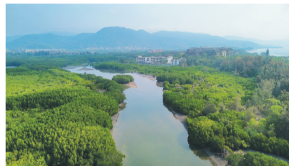
俯瞰三亚青梅港红树林保护区。

从三亚市区驱车前往太阳湾，走海南环岛旅游公路项目三亚太阳湾段，一路经过常见的榕树、雨树等行道树景观后，有一处不足1公里的道路，两侧景观有鲜明不同：道路两侧，设置了由水泥砖和铁丝网形成的围栏。围栏之后，树木相对榕树、雨树较矮，但如此茂密，从近到远，满是绿油油的叶子，一大片不见枝干、不知边际。