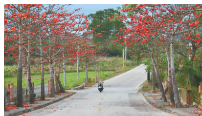
春天里，昌江黎族自治县七叉镇乡村道路旁木棉花盛开。

设计道路之时，有关单位在“穿山”和“绕山”中，在“需要开挖山体的路基建造”和“开挖更小的桥梁”间，每一次都选择了后者，以更高的造价成本，实现了建造道路、保护生态与观赏美景之间的“一箭三雕”，让原生态的崖壁、起源于亿万年前前的海湾风光，共同点亮着更多游人旅行的路。