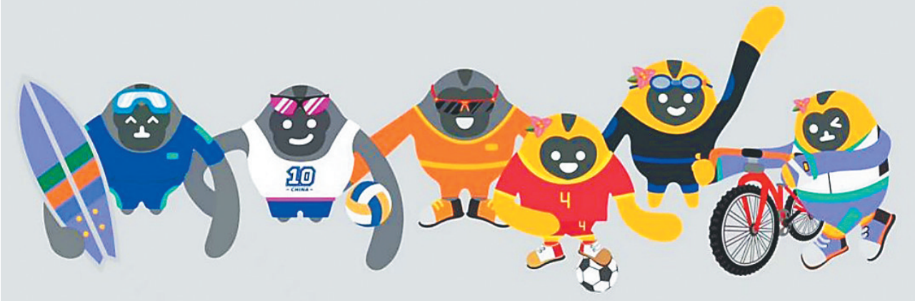
第四届消博会吉祥物IP新形象,从左到右依次是:冲浪猿、沙滩排球猿、滑翔伞猿、足球猿、帆船猿、自行车猿。