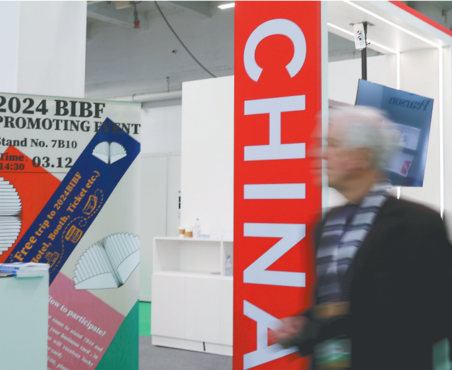
一名参展商经过英国伦敦书展中国出版单位的联合展台。