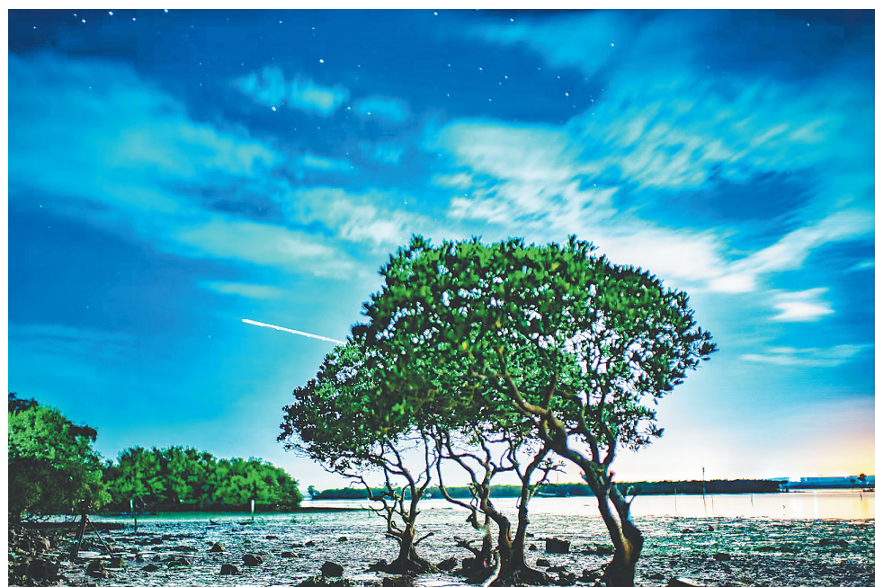
海口市演丰镇林市村的红树。