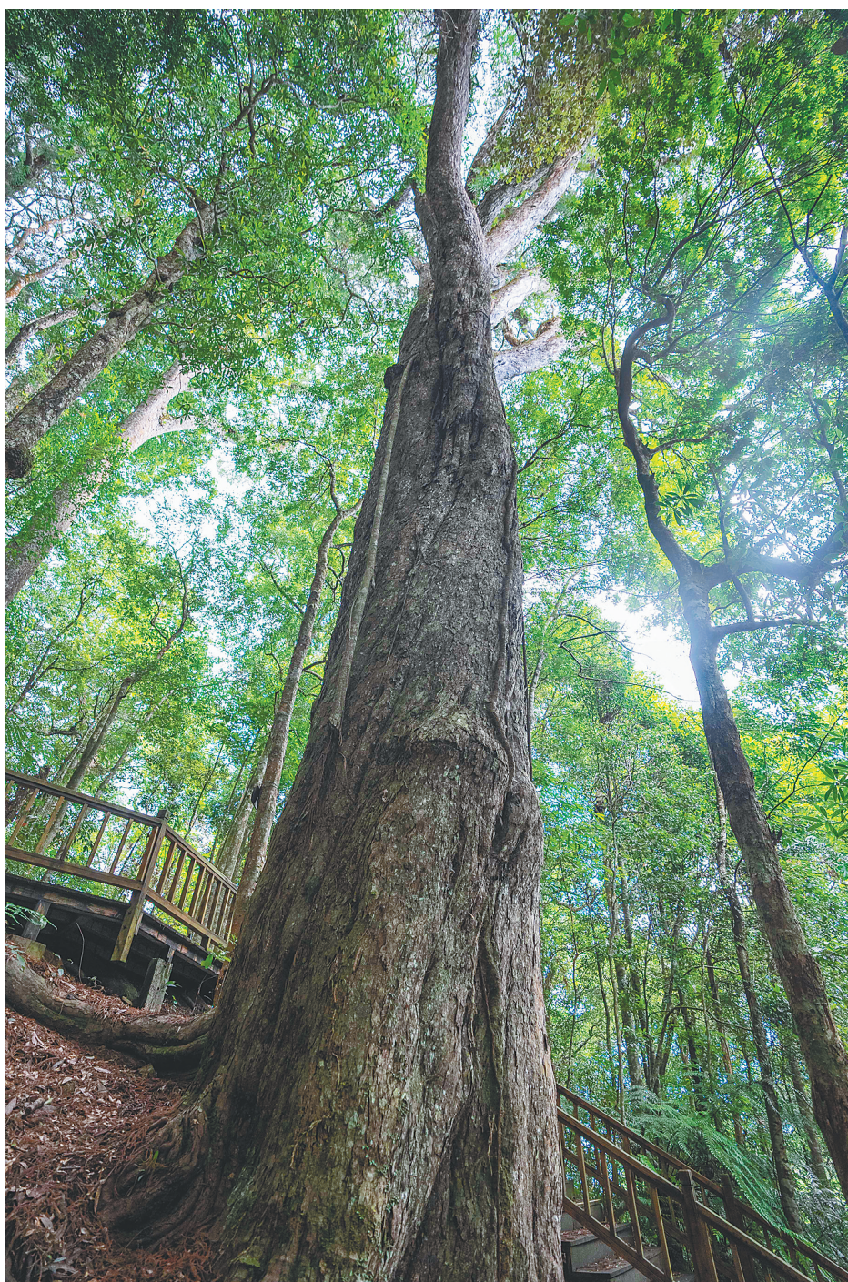
海南热带雨林国家公园霸王岭片区一棵树龄超过2000年的陆均松。