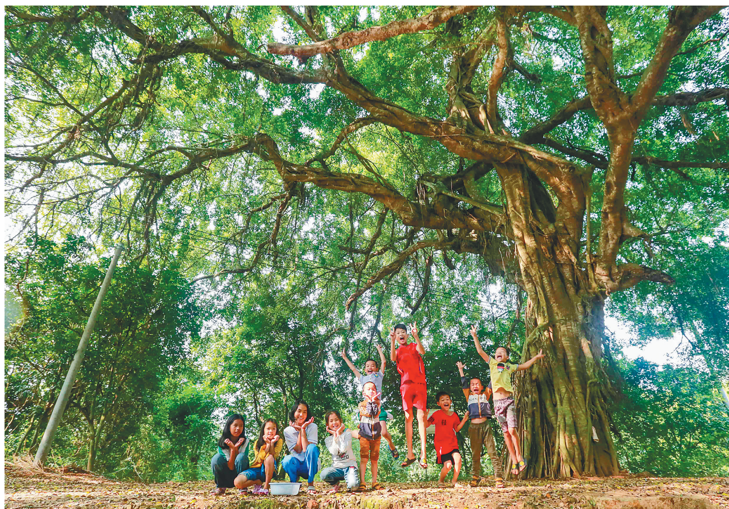
儋州大成镇新坊村一棵小叶榕树。

我们用一张张用心拍摄的图片、一个个充满故事性的瞬间,带你读懂海南,爱上海南,一起分享海南的美。