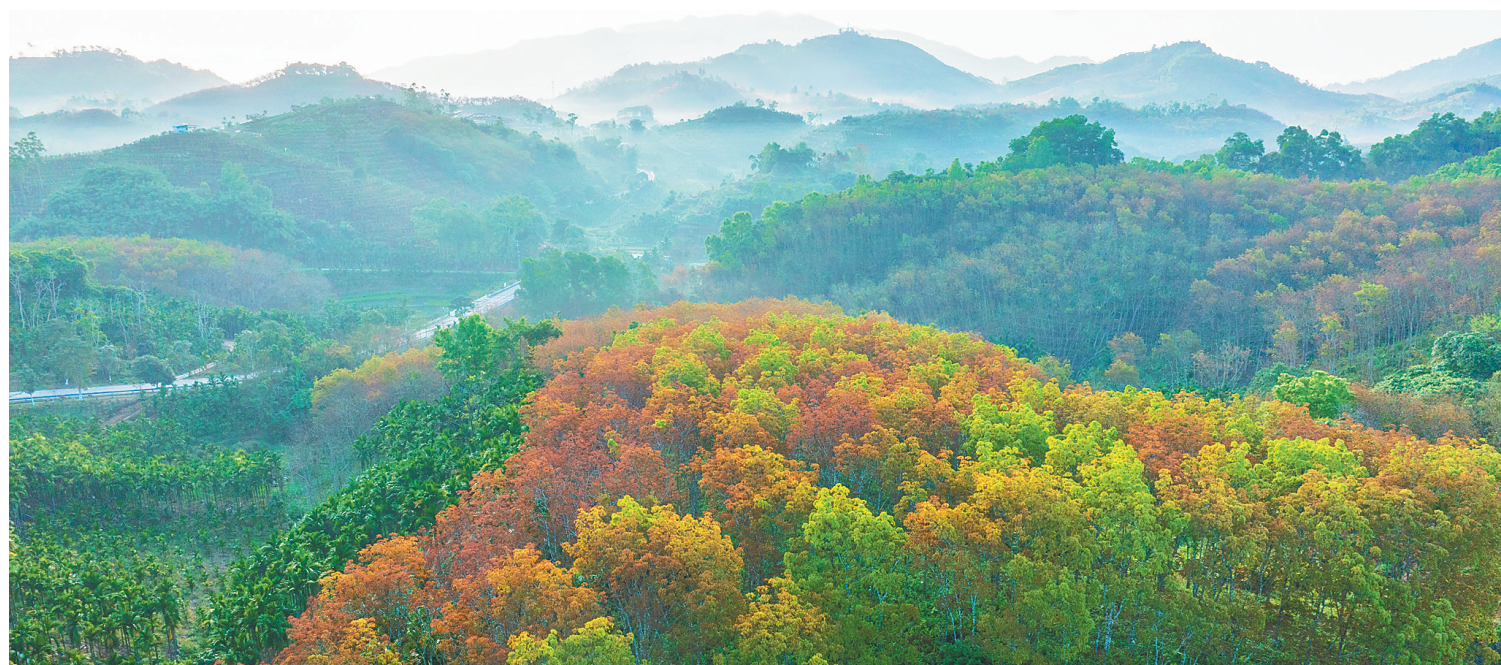
琼中红毛镇的橡胶林。