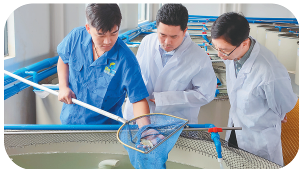
↑农行海南分行普惠金融事业部负责人深入文昌冯家湾现代渔业产业园了解小微企业融资需求。