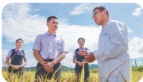
↑农行三亚分行客户经理与南繁科研人员一同查看水稻生产情况。

2023年,农行海南分行积极践行“金融为民”理念,将金融资源汇聚到实体经济发展上来,将优质的金融产品和服务普及到人民群众中去,以高质量金融服务助力海南自贸港高质量发展。