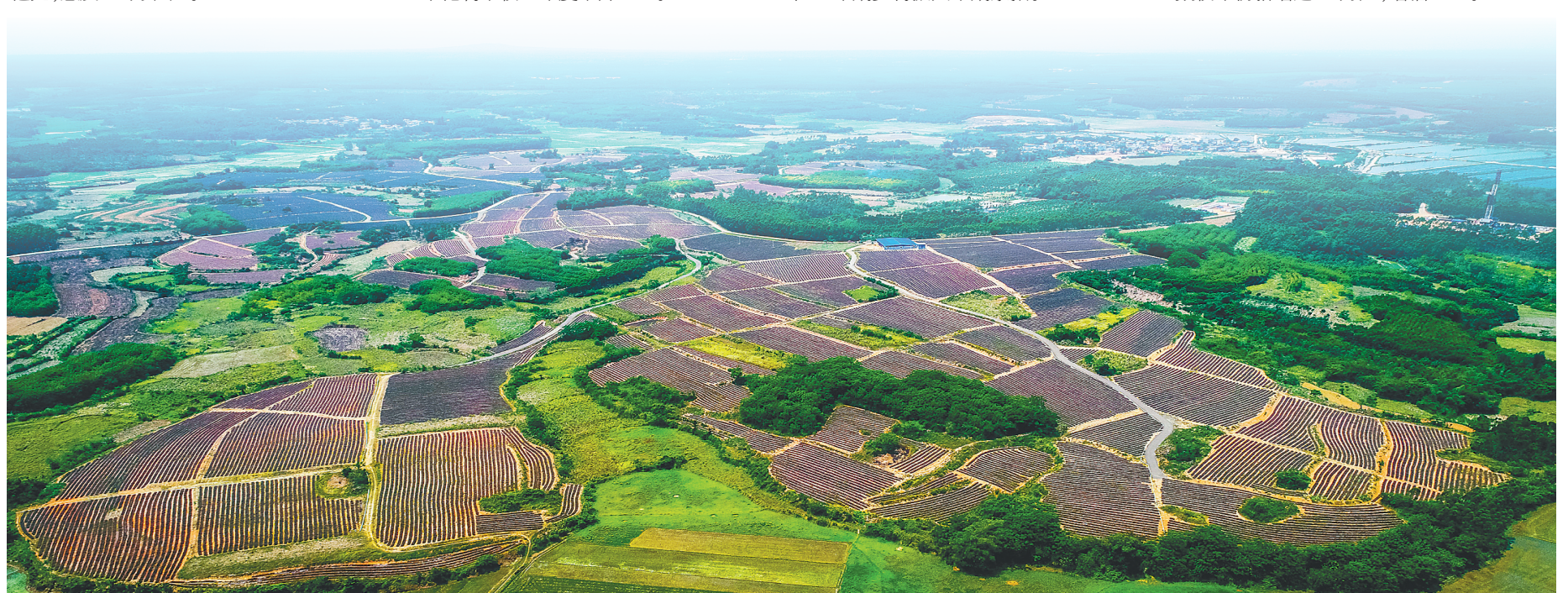
由农行海南分行帮扶建设的临高博厚镇新发村千亩凤梨基地。

农行海南分行多措并举发展消费金融领域各项业务,持续加大线上信贷产品推广力度,不断满足居民日常消费需求。截至2023年末,该行个人贷款较年初新增超21亿元,增幅8.5%;净增信用卡有效客户1.33万户。开展以个人养老金资金账户为核心的综合金融服务,首批上线包括储蓄、理财、基金、保险在内的全品类个人养老金产品,满足客户个性化、多样化的养老投资需求,全年累计开立个人养老金户数4.8万户。做优“浓情暖域”服务品牌,成功创建全行首家“银行业营业网点文明规范服务百佳示范单位”,以示范效应带动提升全行整体服务水平。出台对公业务下沉实施方案,组织开展专项竞赛,推动网点形成对零售“双轮驱动、相互促进”发展格局,提升网点整体服务质效。深耕金融场景建设,全面拓展生产经营和生活消费中的互联网服务场景,不断满足广大客户线上金融服务需求。截至2023年末,该行掌银月活客户数较年初新增近17万户,增幅25%。