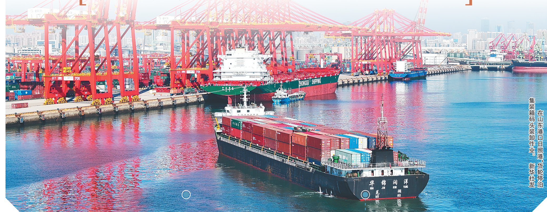
在山东港口日照港,货轮停泊,集装箱码头装卸作业。

实现“十四五”规划目标任务的关键一年,中国经济运行态势备受瞩目。国家统计局18日发布的数据显示,今年前2个月,随着宏观组合政策效应持续释放,经济内生动能继续修复,生产需求稳中有升,发展质量不断改善,经济运行起步平稳,延续回升向好态势。