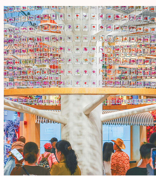
3月16日，三角梅科博园展出的三角梅花标本，吸引众多市民游客观赏。

“产业发展要不断拓展三角梅的应用场景，同步政策引导推动三角梅产学研用一体化发展，整合资源共同为海南三角梅产业健康、可持续、高质量发展而努力。”杨璐认为。