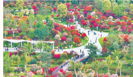
俯瞰三角梅科博园。