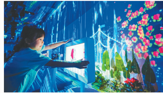
3月16日，在三角梅科博园内，小朋友在电子屏幕上创作“心目中的三角梅”。