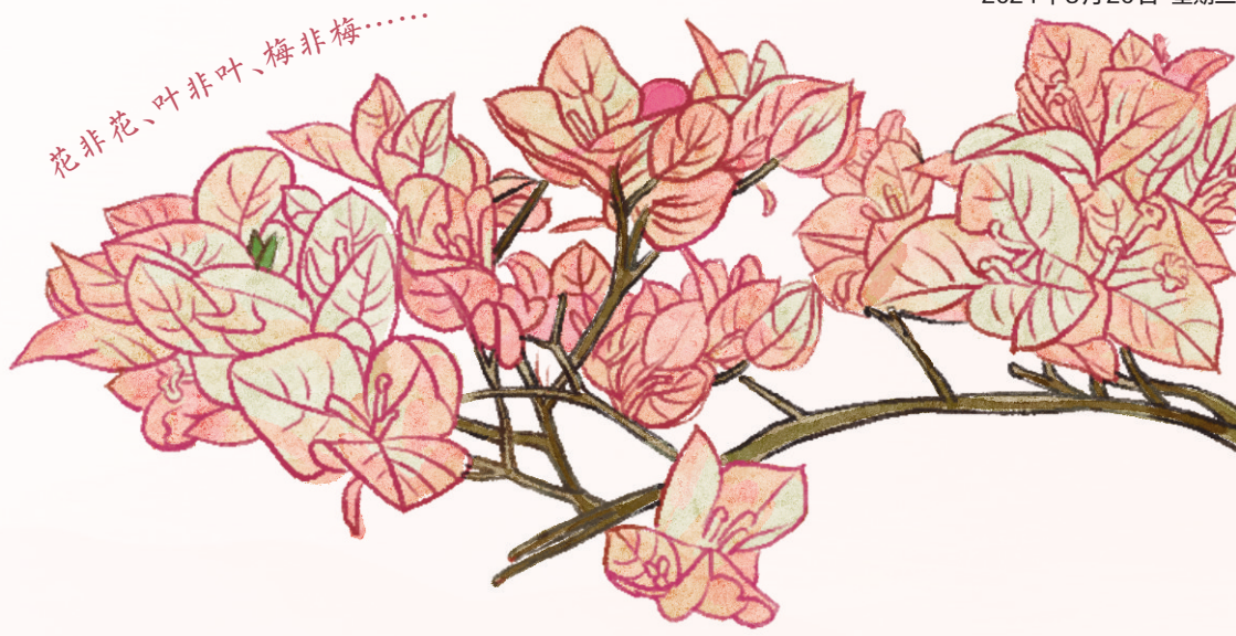
花非花、叶非叶、梅非梅……