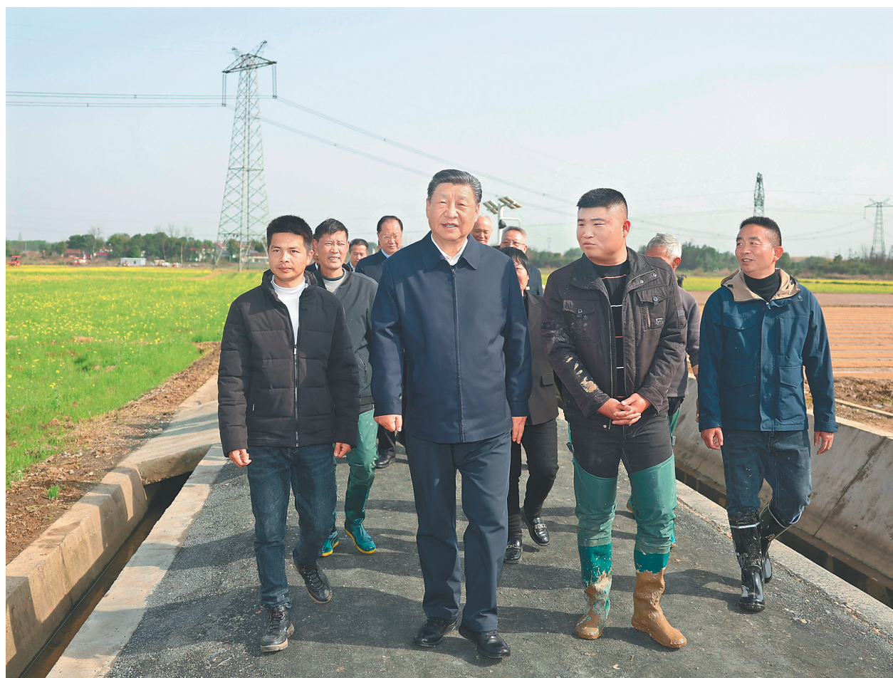
3月18日至21日，中共中央总书记、国家主席、中央军委主席习近平在湖南考察。这是19日下午，习近平在常德市鼎城区谢家铺镇港中坪村，同种粮大户、农技人员、基层干部亲切交流。

新华社长沙3月21日电 中共中央总书记、国家主席、中央军委主席习近平近日在湖南考察时强调，湖南要牢牢把握自身在构建新发展格局中的战略定位，坚持稳中求进工作总基调，坚持高质量发展不动摇，坚持改革创新、求真务实，在打造国家重要先进制造业高地、具有核心竞争力的科技创新高地、内陆地区改革开放高地上持续用力，在推动中部地区崛起和长江经济带发展中奋勇争先，奋力谱写中国式现代化湖南篇章。