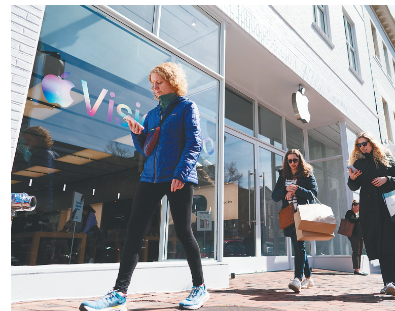
3月21日,行人走过美国首都华盛顿的一家苹果门店。

欧盟委员会本月初对苹果公司处罚18.4亿欧元,理由是苹果在流媒体音乐业务中存在垄断行为。近年来,美国技术巨头面临越来越严格审查。除苹果外,亚马逊、脸书和谷歌也在美国面临反垄断诉讼。