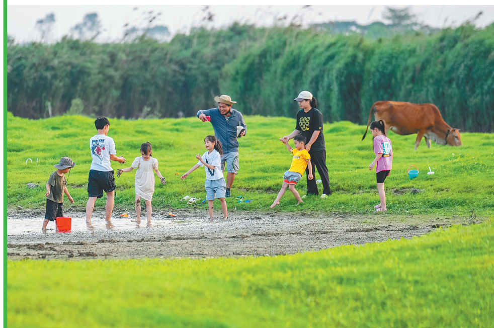
在海口琼山区龙塘镇三桥村，市民游客体验抓鱼乐趣。