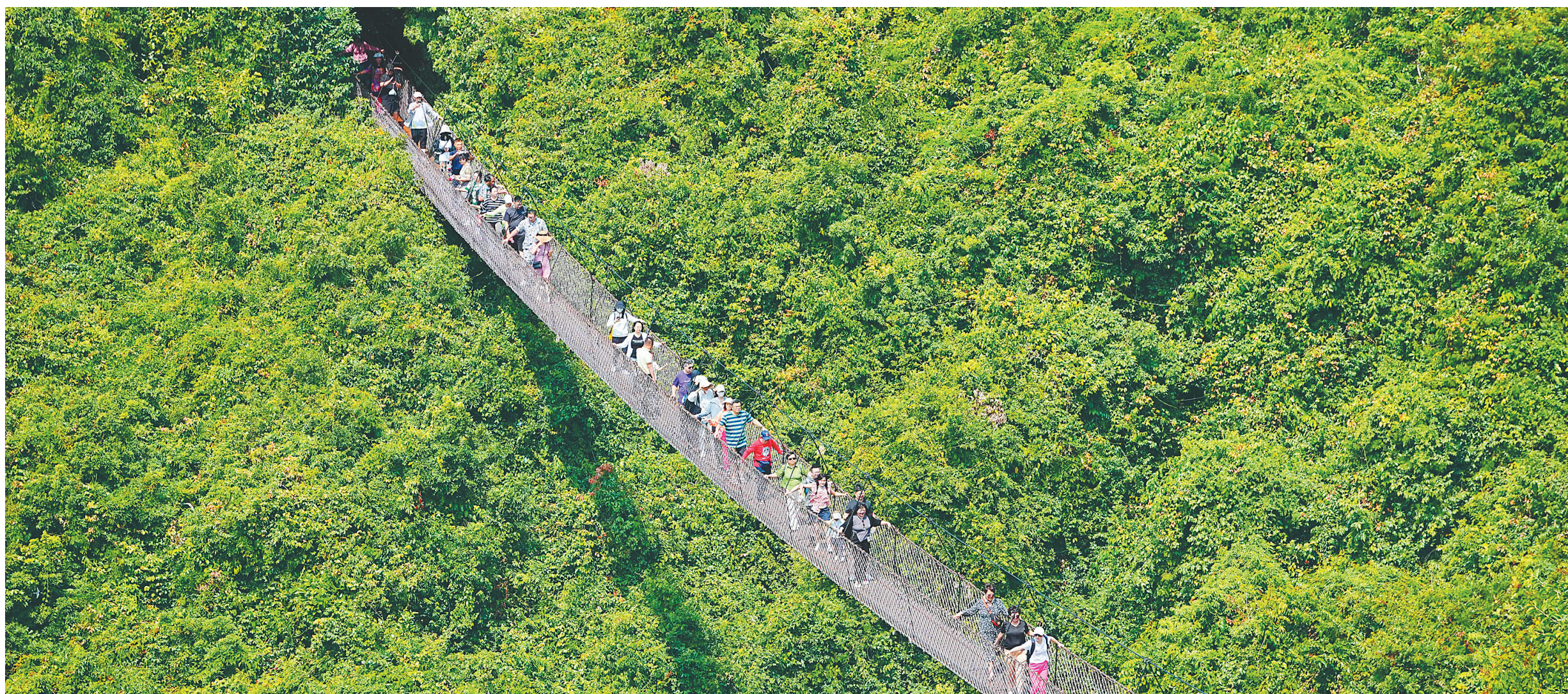
三亚亚龙湾热带天堂森林公园，众多游客前来游玩。