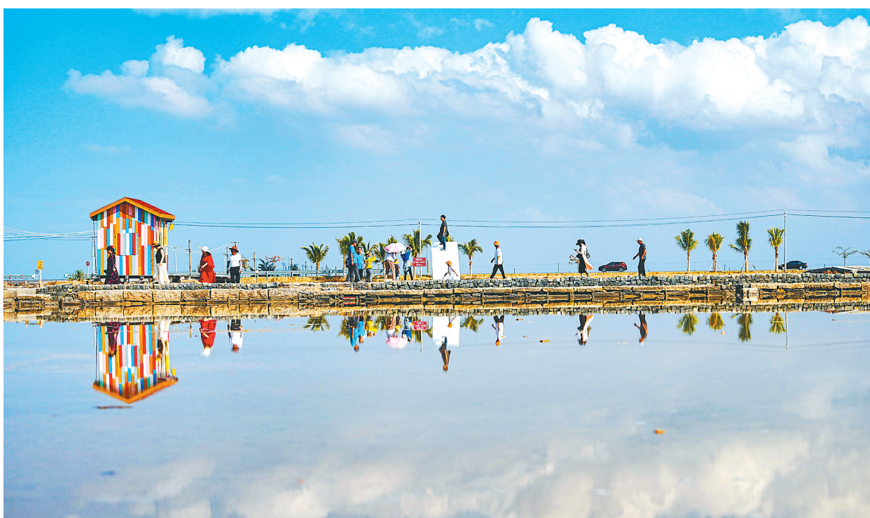
在乐东黎族自治县莺歌海盐场，游人感受盐田风光。