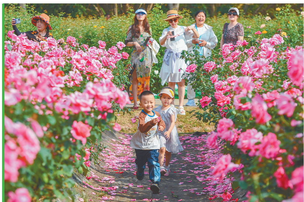
在三亚亚龙湾国际玫瑰谷，游客踏青赏景，畅享美好时光。