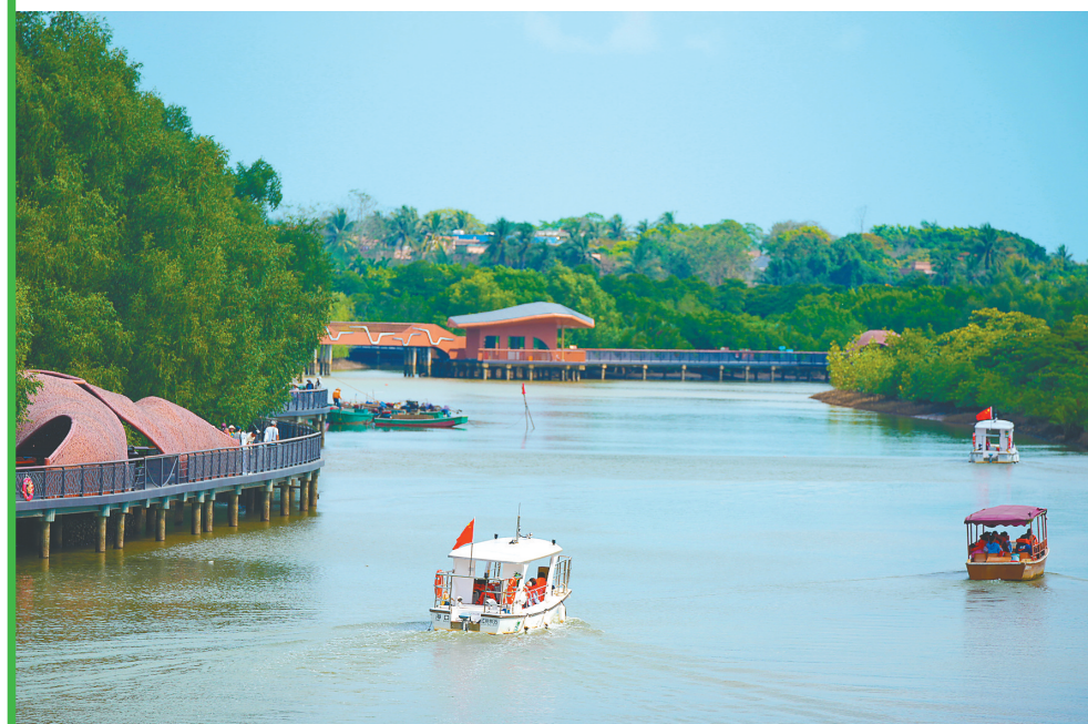
在海口东寨港红树林旅游区，游客乘船游览红树林美景。