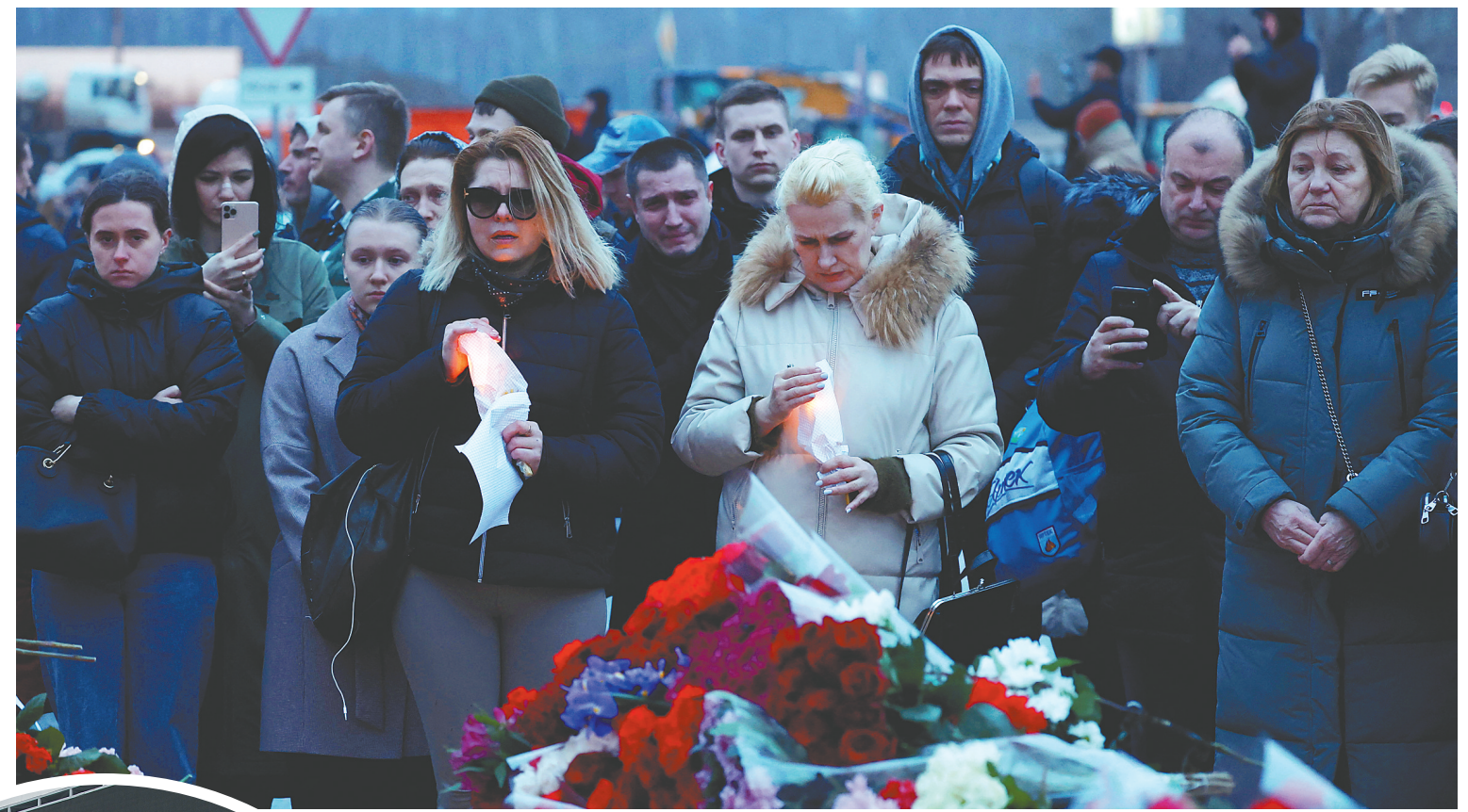
3月23日,在俄罗斯莫斯科近郊,人们在恐袭事件发生地附近悼念遇难者。

近年来,俄罗斯加大反恐力度,大规模恐怖袭击在莫斯科乃至俄罗斯全国并不少见。俄联邦安全局局长、国家反恐委员会主席博尔特尼科夫去年12月12日介绍2023年俄反恐工作成果时说,俄去年阻止了228起恐怖主义犯罪,其中包括146起未遂恐怖袭击。俄方还破坏了73个秘密恐怖组织的活动。 此次恐袭暴露出俄罗斯在安全保障方面仍存在漏洞。俄政治学者米哈伊洛夫认为,俄政府有必要完善大型群众性活动的组织方案。他指出,实施此次恐袭的犯罪分子手段非常专业,且对建筑物内部环境、出入口位置和警卫部署等情况了如指掌,这表明相关人员很可能提前对事发地点进行了详细调查。俄军事专家丹迪金指出,恐怖分子是如何将武器带到音乐厅的,值得有关部门深刻反思。 恐袭事件发生后,俄政府已经开始加强安保措施。普京23日在电视讲话中说,已在全国范围采取额外的反恐和反破坏措施,防止恐怖分子犯下新的罪行。莫斯科市长索比亚宁宣布取消本周末在莫斯科举行的所有体育、文化和其他公共活动,莫斯科州、克拉斯诺达尔边疆区、列宁格勒州、乌里扬诺夫斯克州、库尔斯克州、摩尔曼斯克州和其他一些地区也宣布将采取类似措施。俄航空、铁路等部门纷纷表示,将加强安全防护和检查工作。圣彼得堡等地高校取消了周末线下课程。 (据新华社莫斯科3月24日电 记者赵冰 刘恺)