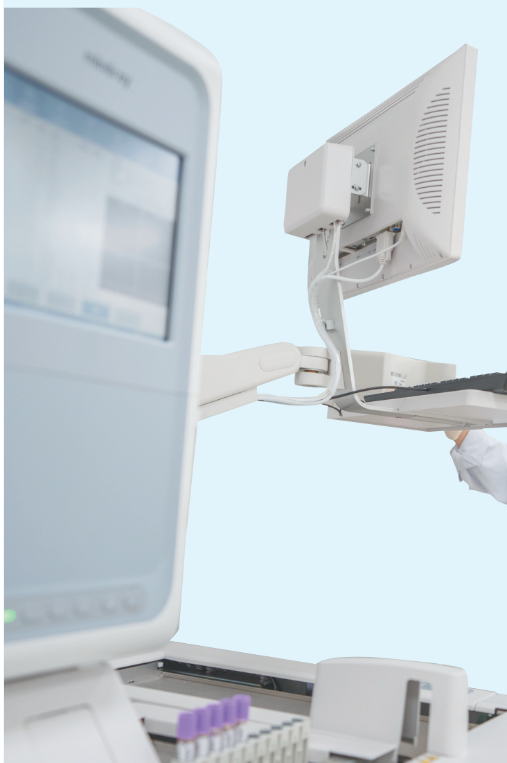
近日，上海交通大学医学院附属瑞金医院海南医院，医生在做检测。