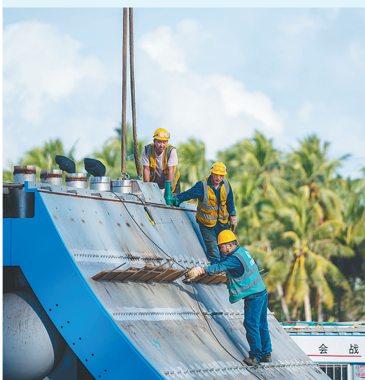
2023年12月16日，海南国际商业航天发射中心，建设者们在作业。