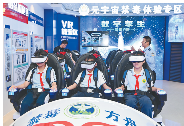
海南省禁毒教育基地，青少年通过AR设备体验毒驾危害。