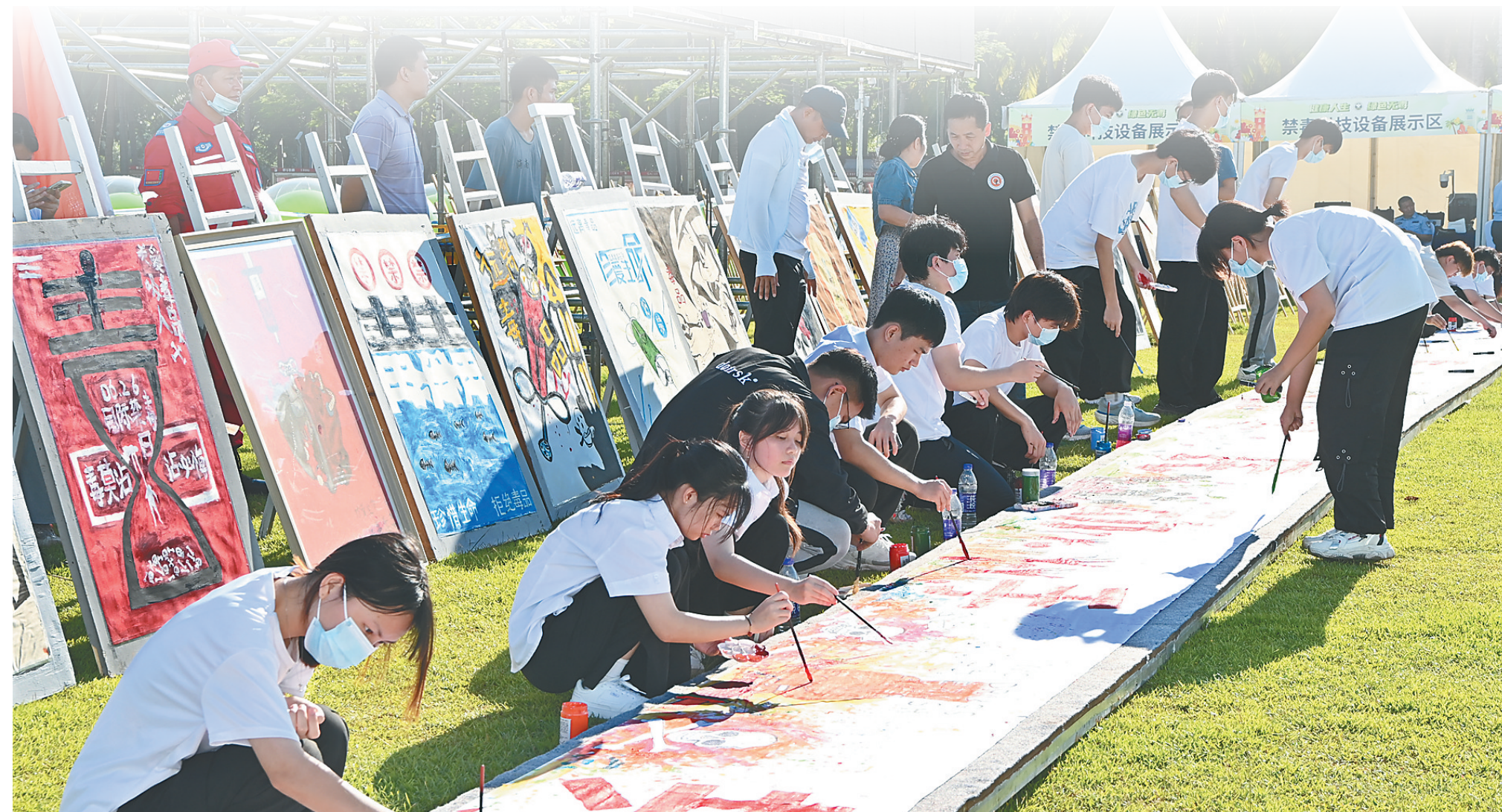
青少年共绘禁毒百米画卷。

当前，合成毒品蔓延，种类多样、更新迭代速度快。针对此情况，张勇安认为，要加强易制毒化学品管理，应从以下三个方面入手：一是要加强对易制毒化学品生产、流通、消费等全过程的监管，防范易制毒化学品走私到非法渠道；二是利用大数据，建立监测预警平台，对易制毒化学品进行全系统跟踪，摸清流出的数量；三是针对有组织的犯罪坚持综合施策，从金融、流通、执法等各个环节进行有效打击；此外，只有通过经济社会的发展，才能最终解决有组织犯罪，毒品治理需要从综合的角度、从多元的角度来重新思考，寻找毒品问题的解决方案。