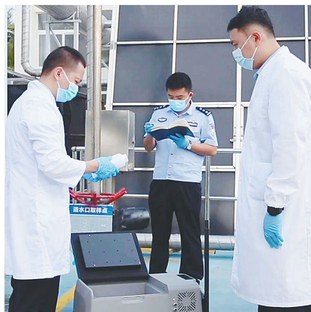
民警在开展污水毒品检测。