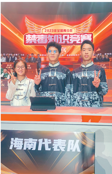
海南代表队参加2023年全国青少年禁毒知识竞赛总决赛。