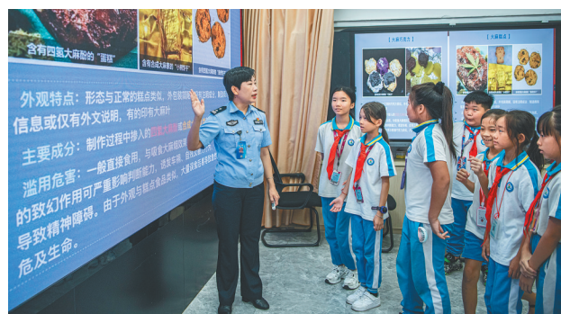
青少年参观毒品预防教育基地。

通过建设禁毒新媒体中心，开办自贸港禁毒普法云直播平台，推进线上与线下联动、传统媒体与新兴媒体融合，拓展宣传途径，扩大宣传范围。推动民俗文化与禁毒宣传深度融合，策划打造禁毒琼剧巡演、禁毒黎歌演唱法等一大批体现地方特色的禁毒群众文化作品，组织“蒲公英”“蓝盾”等禁毒宣讲团进学校、进社区、进农村，让禁毒文化、禁毒意识扎根人心。专门针对未成年人编印毒品预防教育读本，开展“禁毒开学第一课”“禁毒护苗”“万师访万家”和“6·26”国际禁毒日等系列宣传活动，让未成年人系紧拒毒防毒的“第一粒扣子”。