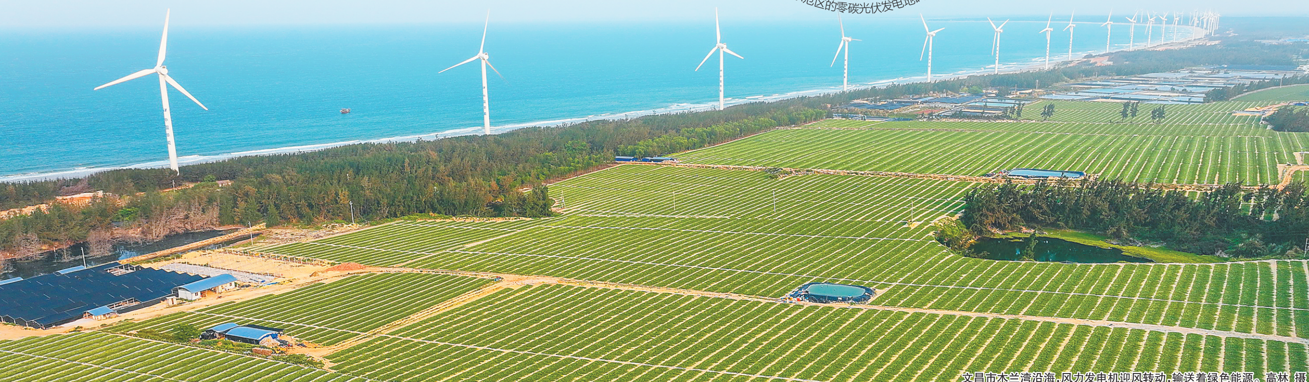
文昌市木兰湾沿海，风力发电机迎风转动，输送着绿色能源。