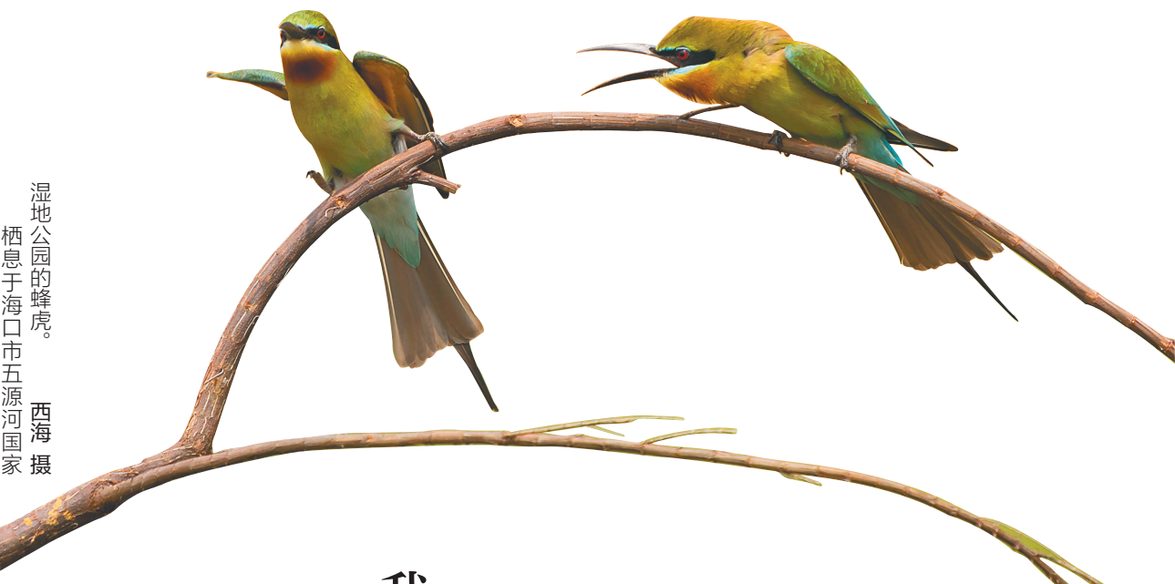
湿地公园的蜂虎。 栖息于海口市五源河国家