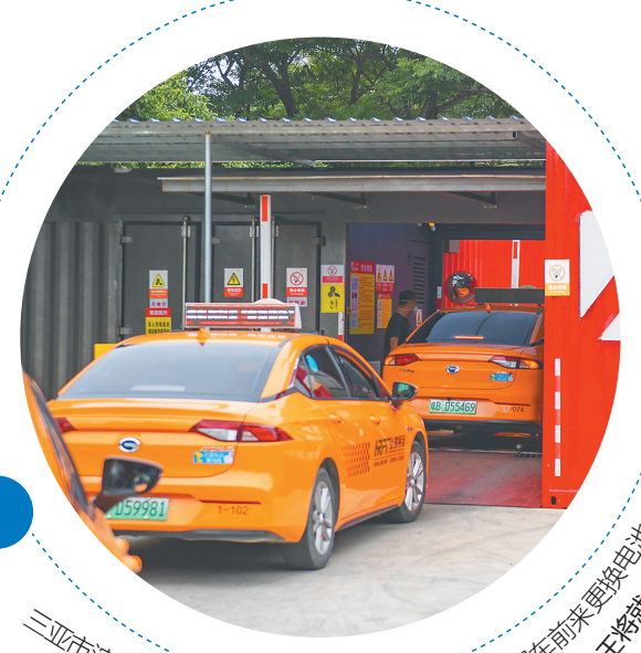
三亚市湾河公园的一处新能源汽车换电站，不少出租车前来更换电池。

青山不老，绿水长流。遵循人与自然和谐共生，过去和未来在此交汇。（文/周一 秀英）