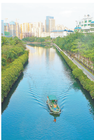
海南深入推进“六水共治”，图为海口市美舍河国兴桥段，环卫工人开船打捞河面垃圾。

作为美丽海南建设的主力军和排头兵，我省生态环境系统扛起责任担当，持续以更大的决心和力度开创海南生态文明建设新境界，强化自贸港建设的生态环境保障，以实际行动切实肩负起建设“美丽中国”的海南担当。