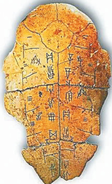
最古老的文字档案——甲骨档案。资料图

历史上最早的档案汇编，是2000多年前孔子编选的《尚书》，其中包括商、周的一些重要史料。河北平山中山王墓出土的铜制建筑图，是现存最早的工程图档案，它用金银丝嵌制在铜板上，距今已2200多年，依然线条明朗，“中宫垣”“内宫垣”等图示十分清晰。迄今所见最早的地图档案，是1973年长沙马王堆汉墓出土的缙帛舆图，它用生丝织成，墨写文