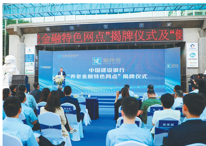
建设银行在海口举办“健养安”首批养老金融特色网点揭牌仪式。