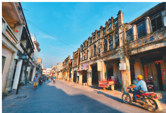
崖城骑楼。