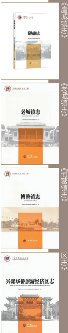
《崖城镇志》 《老城志》 《博鳌镇志》 《兴隆华侨旅游经济区志》

作为最基层行政组织的志书,镇志是最接近中国社会变迁的国情、地情记录文本,具有重要的历史文献价值。