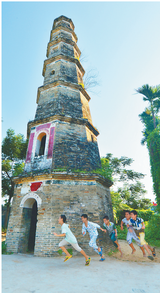
崖州迎旺塔。