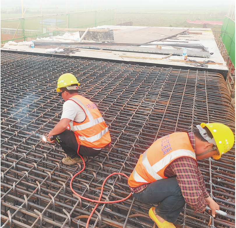
施工人员在绑扎、焊接箱涵钢筋。