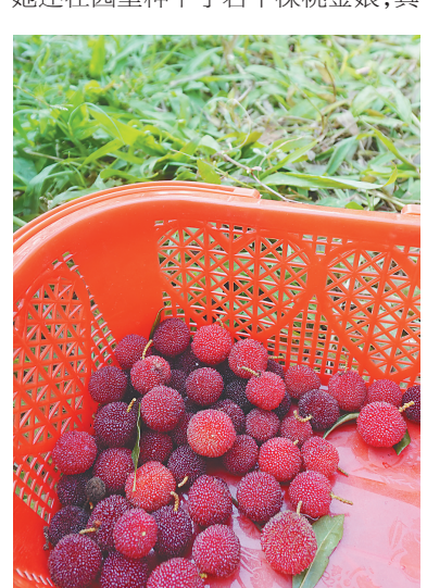
杨梅鲜红饱满。

富佳生态农业杨梅园热闹的采摘场景是儋州大力推动农旅融合发展,以“休闲农业+乡村旅游”模式推动乡村振兴的生动体现。为了充分利用土地面积,实现“一片土地多种收入”,梁水晶还栽种了近3000株槟榔树。“槟榔长高后不影响杨梅树的生长,也能获得一笔可观的收入。”梁水晶介绍,她还在园里种下了若干棵桃李娘,其