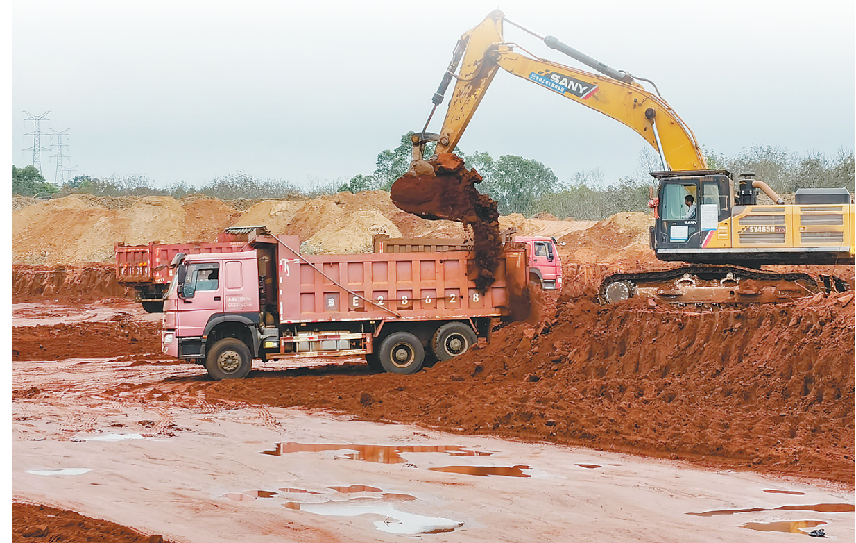
洋浦疏港高速公路1标段项目施工现场。

据了解,在洋浦工作生活的居民大部分居住在东部生活区,大部分的学校也集中在这里,随着海上潮涌、幸福城等小区的投入使用,在东部生活区居住的人越来越多,但这一区域没有一个有规模、上档次的农贸市场,给居民的生活带来不便。