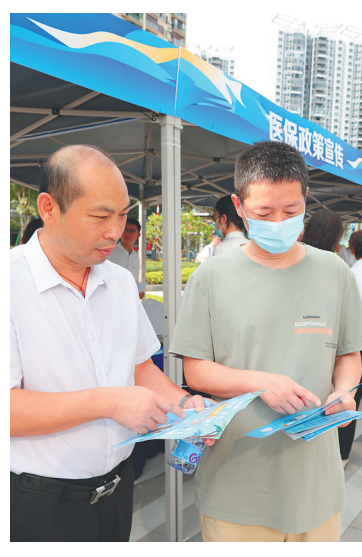
工作人员向三亚市民宣传医保政策。