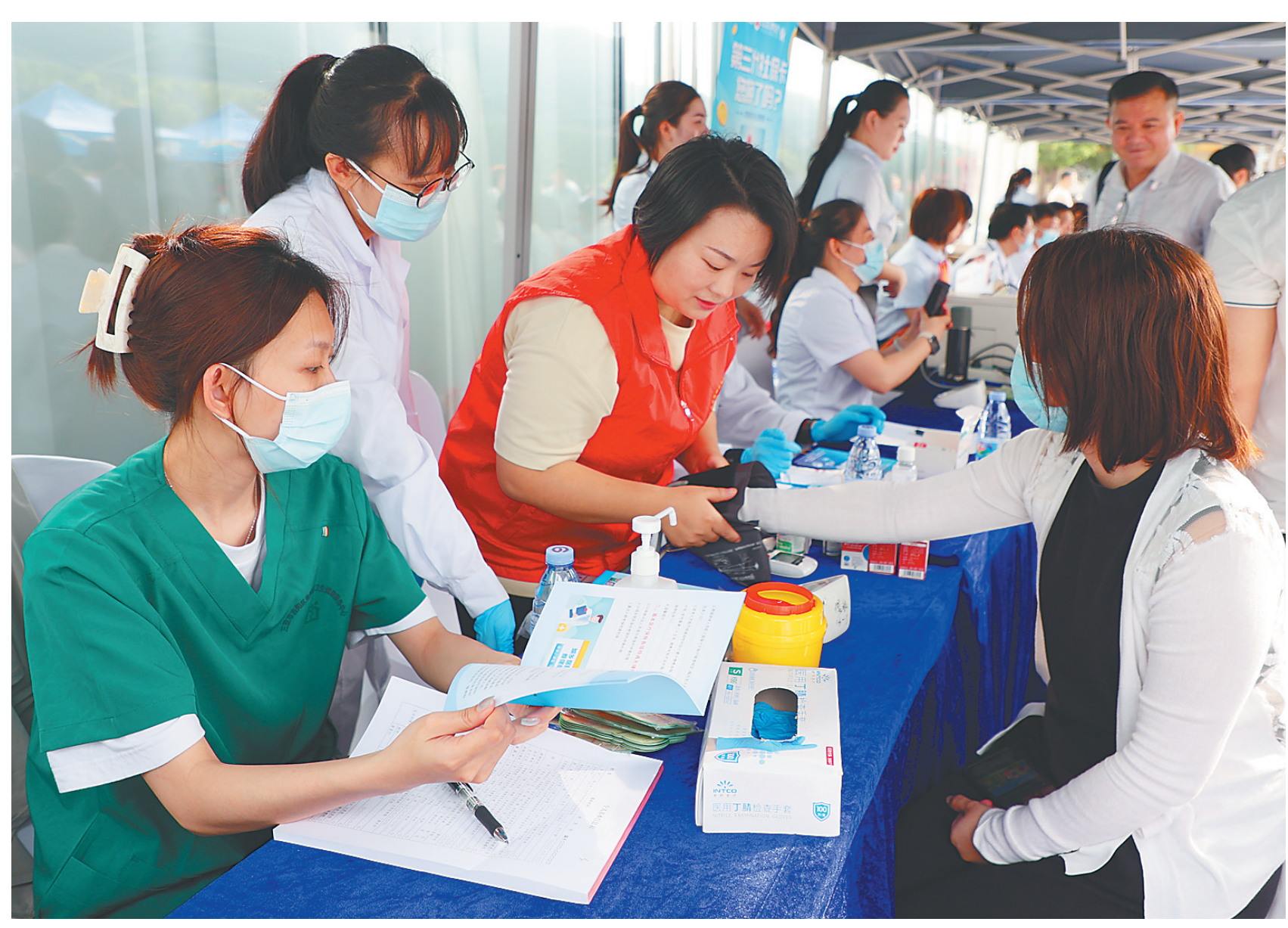
工作人员为市民测量血压,解答医保政策相关问题。