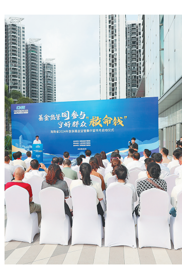
海南省2024年医保基金监管集中宣传月活动启动仪式现场。