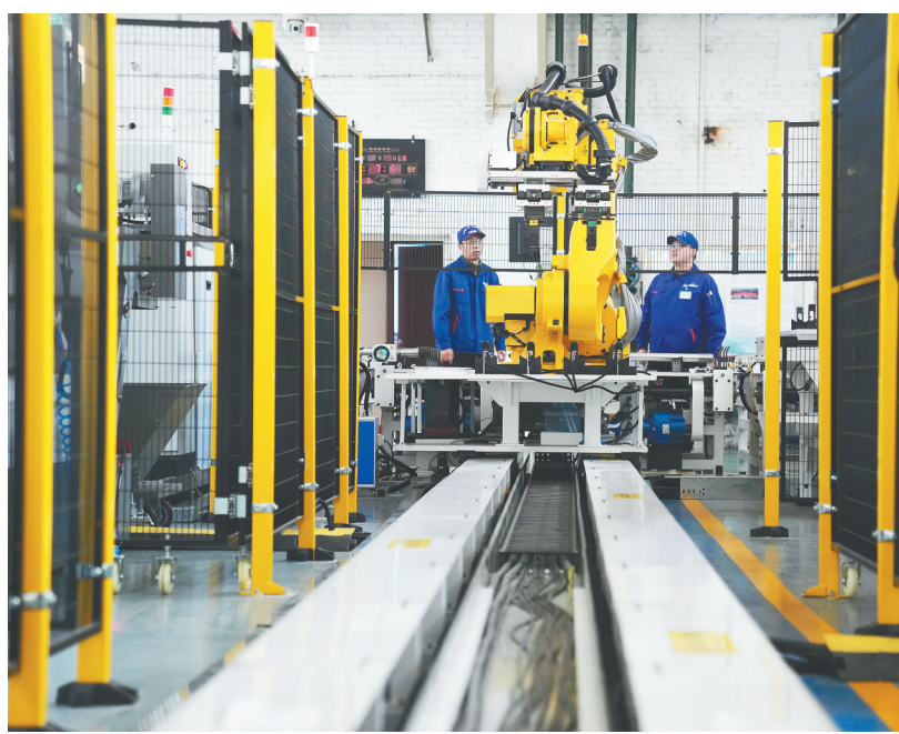
在哈电集团哈尔滨汽轮机厂有限责任公司金工厂的中小零部件数字化生产线,工作人员在观察智能设备运行情况。