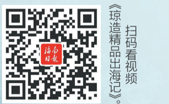
《琼造精品出海记》 扫码看视频

从土产珍物,到冷链鲜品、科技尖货,即便在信息高速交换、人工智能潮涌四海的当下,乘风“出海”的各类精品好物,仍是海南与世界最真实可感的连接。