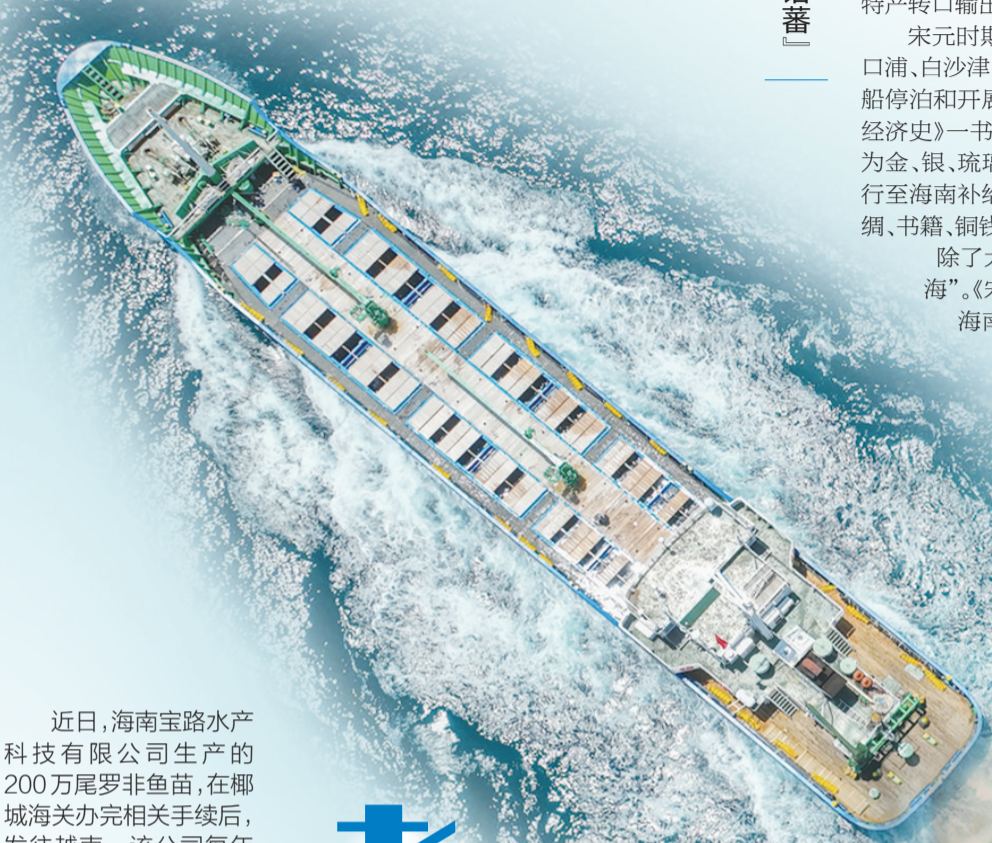
万宁大洲岛海域,一艘装载鱼苗的船舶出发前往日本。