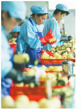
2008年3月31日,定安一家企业的工人在生产菠萝罐头。这些菠萝罐头大部分销往海外。

海南岛四面环海,从古至今,这片海对海南人来说,是横亘眼前的天然阻隔,也是连通世界的经济走廊。从古代的槟榔、布匹、砂糖,到新中国成立后的红碎茶、香茅油、菠萝罐头,再到建省办经济特区后的鲜果、汽车、药品、机电产品等,产自海南的老品牌、新尖货,一次次刷新世界对“海南造”的认知。