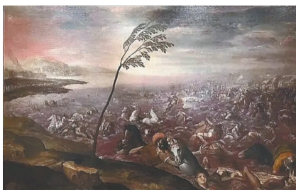
《穿越红海》,保罗·委罗内塞,1560年。

这一次,中国观众可以穿越500多年的时空,近距离感受威尼斯画派的魅力,以及那个时代的美学特征。