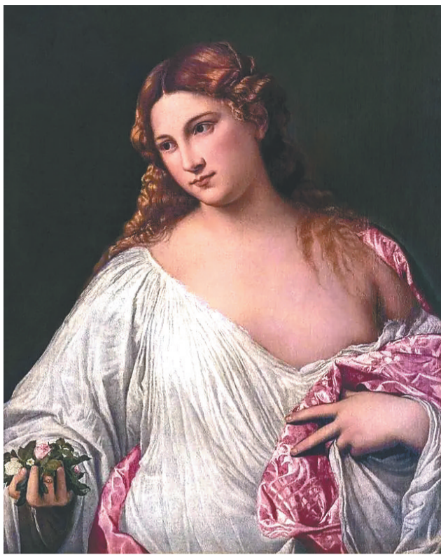
《花神》,提香·韦切利奥,1515年—1520年。

作为欧洲艺术史上影响深远的流派,威尼斯画派能在意大利文艺复兴时期大师如云的格局中傲立画坛,主要的贡献有两个方面:一是在内容上开创了一种全新的题材“美人肖像”,对美的追求和爱情的礼赞,使得理想化的女性肖像画在欧洲画坛获得史无前例的重要地位。二是首次将一直作为附庸摆设与衬托的自然风光,作为人类情感的载体,以一种别开生面的方式,将风景画作为描绘主体,开启了风景画的先河,其对17世纪荷兰将风景画作为完全独立的画科起了关键的作用。从这个意义上说,这个展览不仅是一场盛大的视觉盛宴,还是了解意大利文艺复兴时期文化艺术特质的一个重要途径。诚如意大利驻华大使安博思先生所言:“在马可波罗逝世700周年之际,我们希望通过这一重要的文化活动,与大家分享有关意大利和中国历史艺术身份及其长达几个世纪的对话的新视角。”