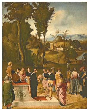
《摩西的考验》,乔尔乔内,1502年—1503年。

其宽度与强度,尤其是脸部与胸部那微妙丰富、晶莹剔透的肤色,我们五个多世纪后再看,依然感觉到此画似乎是刚刚完成般的光彩照人。这里里程碑式的艺术创新,不仅完善了威尼斯画派的技法,而且对整个欧洲绘画,尤其是17世纪的巴洛克艺术风格的确立,起了关键的作用。另外,像他的《维纳斯·丘比特·狗与山鹑》《慈悲圣母》《托马斯·莫斯特肖像》等作品,无论是神话宗教故事,还是肖像、风景画作品,都以最浓烈的情感、绚丽的色彩、新颖的构图,以及豪放的笔触,去呈现一个活色生香的艺术世界。