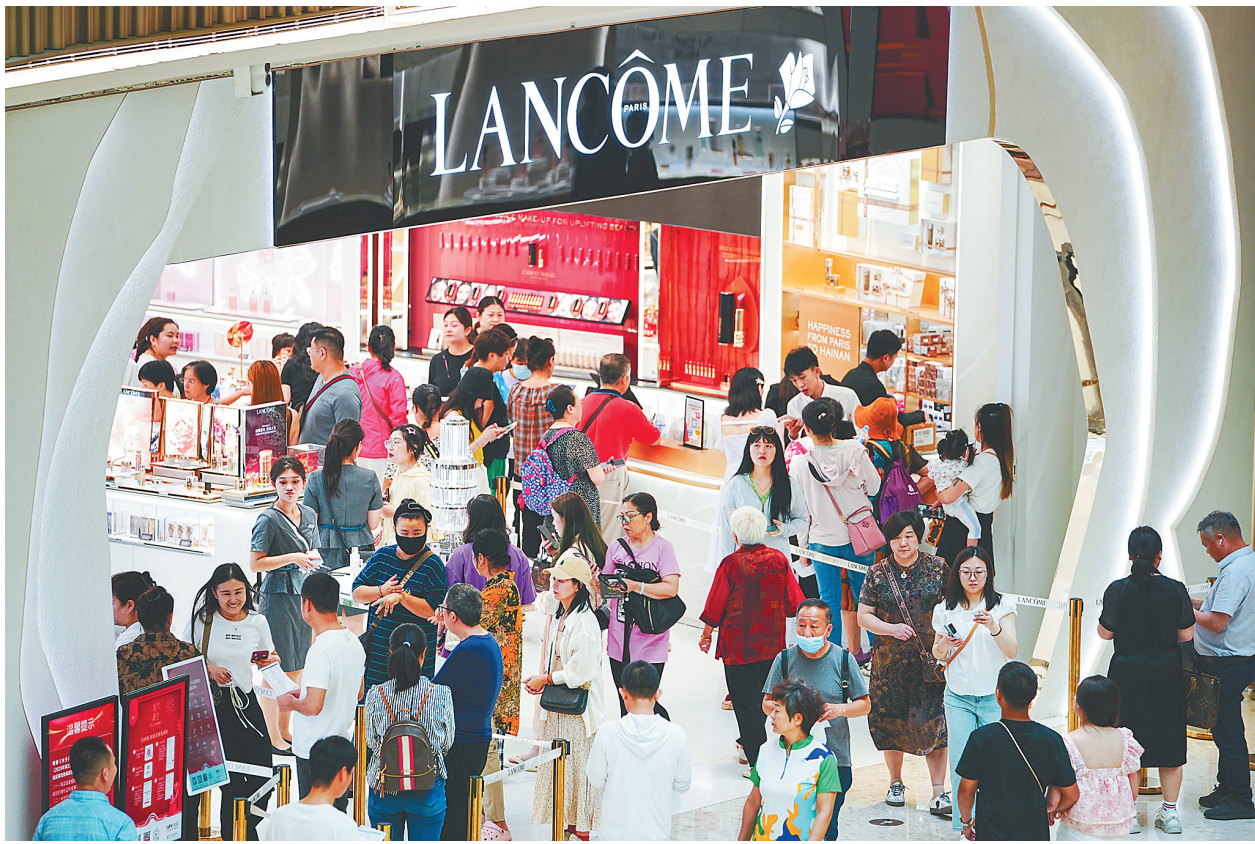
近日,在cdf三亚国际免税城内,众多市民游客前来选购免税商品。