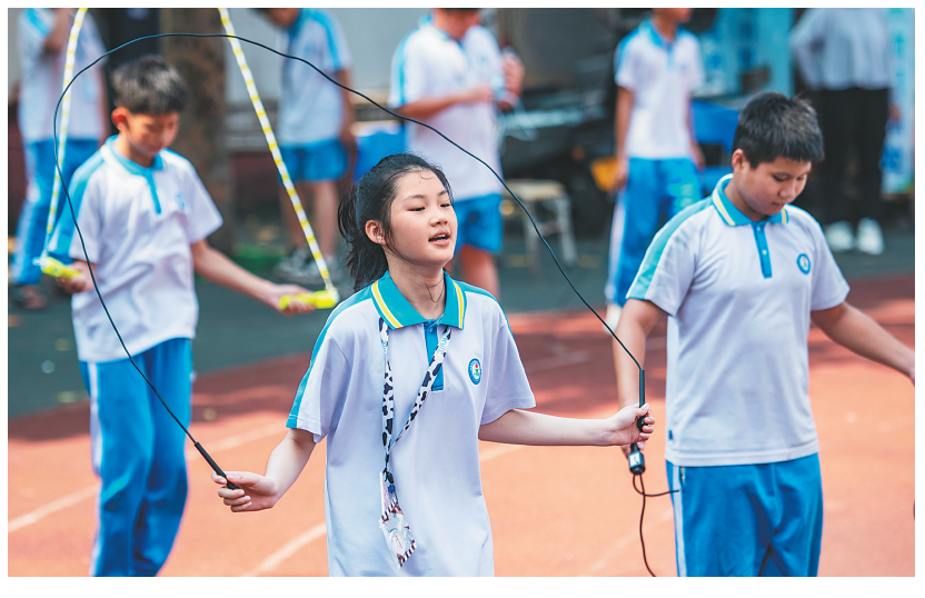
跳绳、跑步、走廊操……琼海市嘉积镇中心学校第三小学近日开展大课间(学校为提高学生身体素质,在课与课之间增加的体育活动时间)活动,让学生们在生动有趣的活动中增强体质、健康成长。