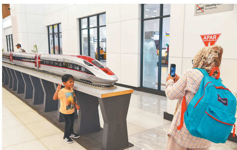
在印度尼西亚雅加达哈利姆站候车大厅,一名小朋友和雅万高铁高速动车组模型合影。

泰国是东南亚重要的汽车生产国,中国车企在泰国建立电动汽车产业链,推动当地汽车产业向绿色低碳转型。泰国国家研究院泰中战略研究中心主任苏拉西·塔纳唐认为,中国