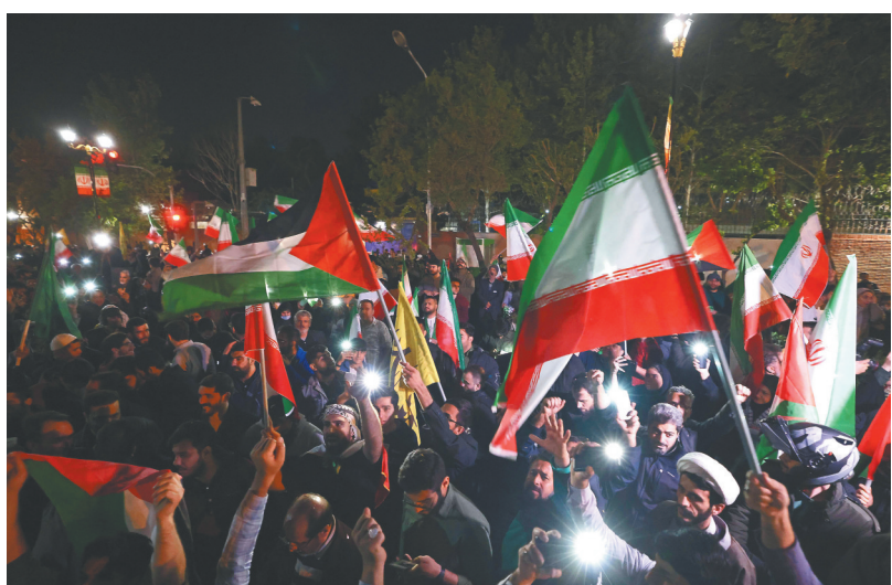
4月14日，伊朗民众在首都德黑兰集会，支持对以色列的报复性打击。

伊朗伊斯兰革命卫队当地时间14日凌晨宣布向以色列目标发射了数十枚导弹和无人机。据以色列媒体和医疗部门消息，多个城市响起防空警报，并伴随着爆炸声。伊朗袭击以色列目前情况如何？以色列做出了何种回应？袭击将对地区局势造成怎样的影响？