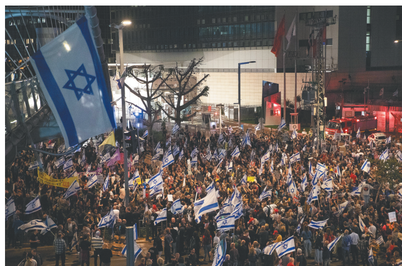
4月13日晚，在以色列特拉维夫的以色列国防部前，民众在安全警告生效前举行示威集会。