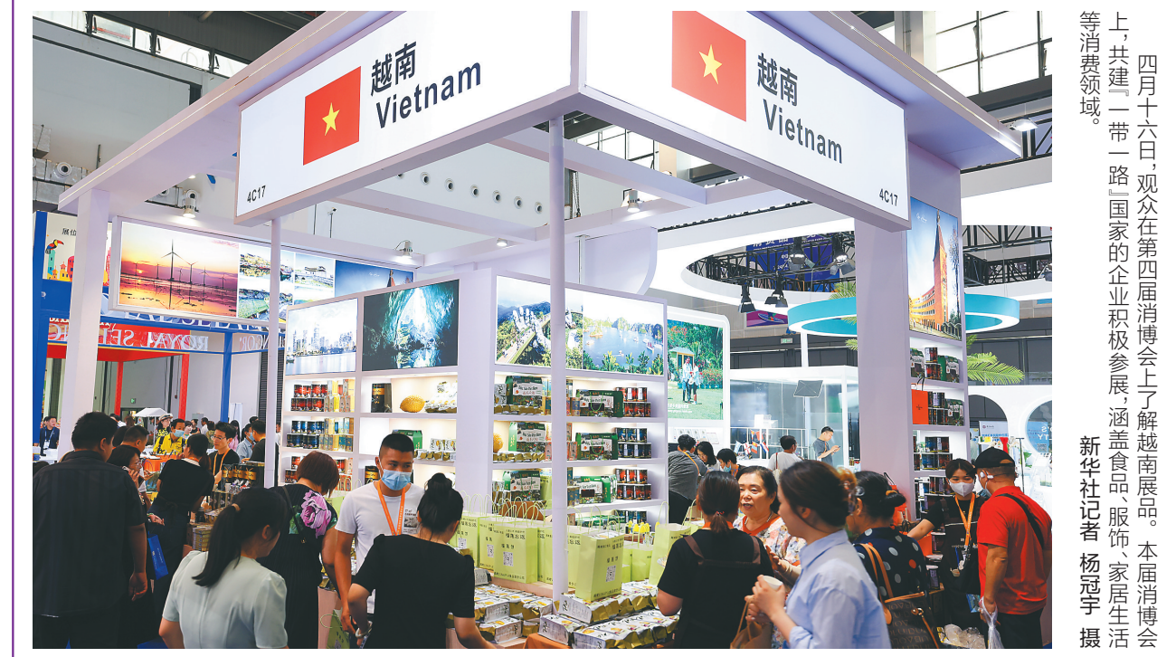
四月十六日,观众在第四届中国国际消费品博览会上了解越南展品。本届消博会上,共建“一带一路”国家的企业积极参展,涵盖食品、服饰、家居生活等消费领域。

“真是科技改变生活,我正在考虑装修新房子时采用全屋智能。”参观完华为在展区场外设置的“未来之家”后,参展商李先生发出感叹,智能化设备无间协作给生活带来诸多便利。下转 A06 版