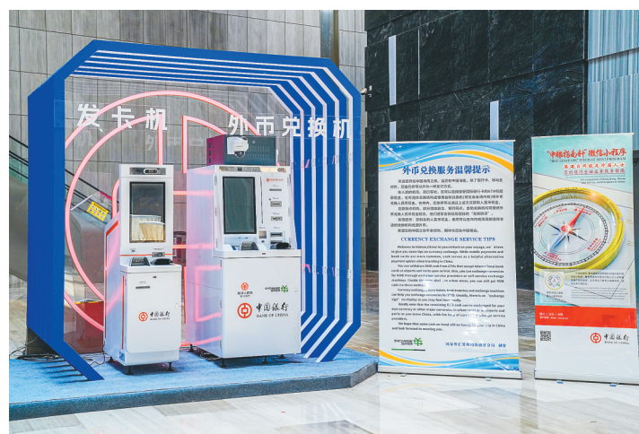
中国银行在消博会现场布设的数字人民币自助发卡机和外币兑换机。