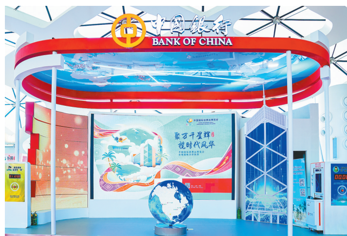
第四届消博会现场的中国银行品牌形象展台。