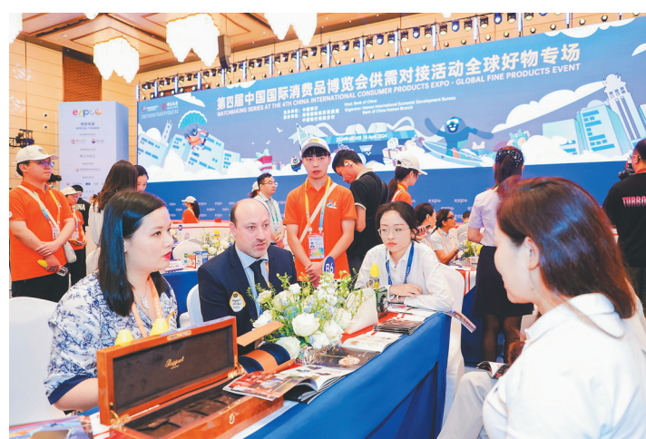
国内外展商在中国银行主办的跨境撮合会全球好物专场洽谈合作。