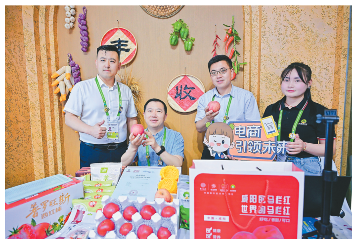
中国银行定点帮扶村集体电商团队在消博会现场直播带货。

一系列精彩活动的圆满举办，不仅满足国内外参展商客的金融需求，也展现了中行的大行担当和强劲实力。