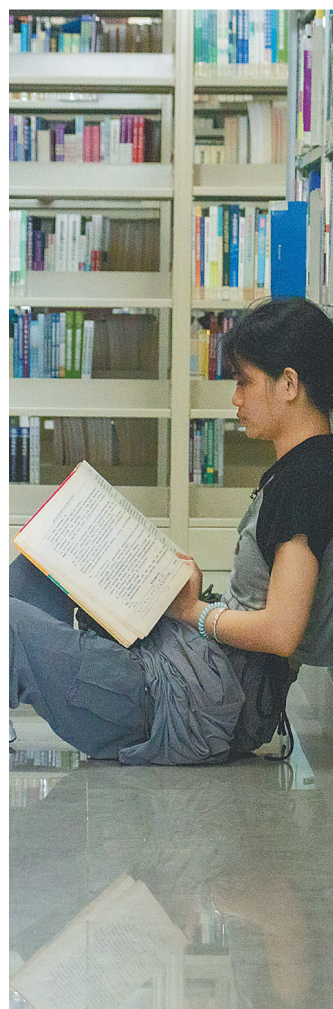
读者在海口市龙华区图书馆内阅读。

“于我而言，阅读还是疏解低落心情的一味良药，不仅能让我转移注意力，也带我走进另一个世界，为心灵寻得休憩之所。”王钟满说。