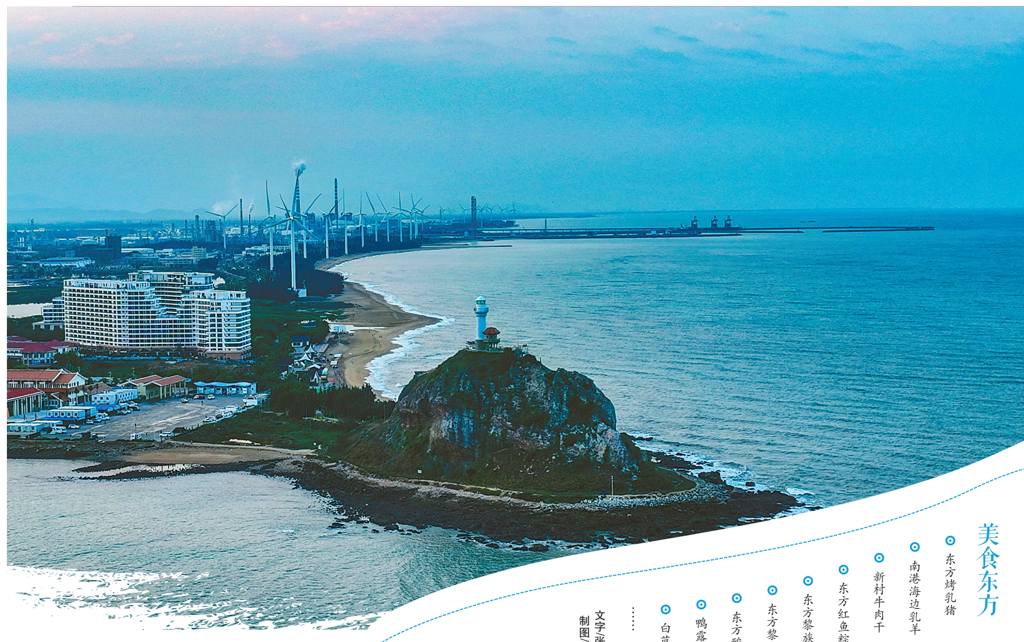
东方市鱼鳞洲风景区的朝霞美景令游人陶醉。