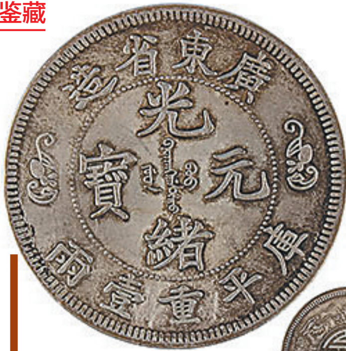
光緒元寶双龙寿字币（正反面）。

当然，日常购物可能用不到一整锭元宝，即便是小元宝，也难免出现找零问题。为此，不但商家常备称重的戥秤，买家很多时候也会随身携带小秤，用来称银子重量。清朝时期，有个欧洲旅行家就看到如下场景：“当地最穷的人都会随时随地带着秤和一把钢剪。前者用于称重，后者用于剪割银子。他们做的事情非常灵活巧妙，如需要二钱银子或五厘银子，一般情况下一次就能剪下差不多对等的重量，但有时为了精确操作，可能要花上两个时辰。”这种让洋人感到诧异的支付方式，其实是当时钱币交易找零的常态。而银元宝为何做成周边凸起的马蹄形，就是因为这部分比较薄，方便剪切而已。