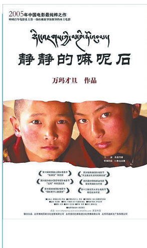
《静静的嘛呢石》海报