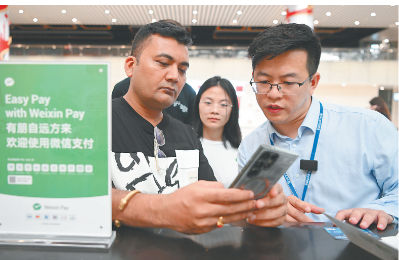
在广州白云机场二号航站楼境外来宾支付服务咨询台,来自印度的旅客(左)在咨询微信支付业务。

中国人民银行有关人士介绍,下一步中国人民银行将抓紧相关制度文件立改废释工作,确保各项制度系统集成、协调高效。根据过渡期安排,有序开展支付业务许可证换发工作,督促支付机构依法合规开展业务。严格落实有关规定,将非银行支付行业的全链条监管纳入法治化、规范化轨道,以服务实体经济为本,优化支付服务市场秩序。