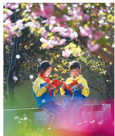
4月23日,山东省淄博市沂源县悦庄镇中心小学的小学生在校园里读书。