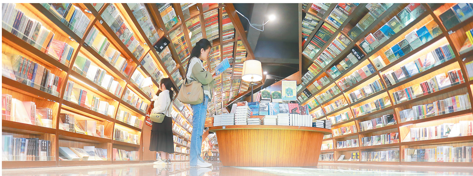
4月23日,读者在江苏扬州的钟书阁书店内阅读图书。